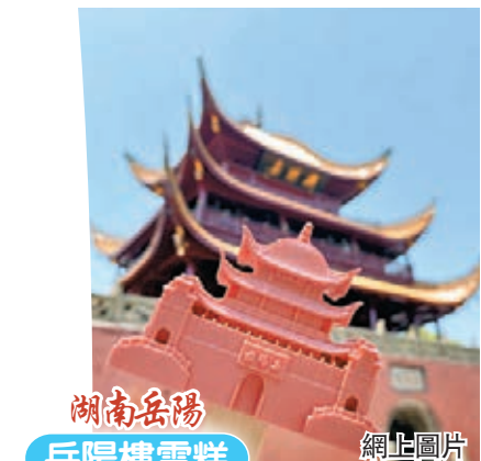
湖南岳陽 岳陽樓雪糕 網上圖片