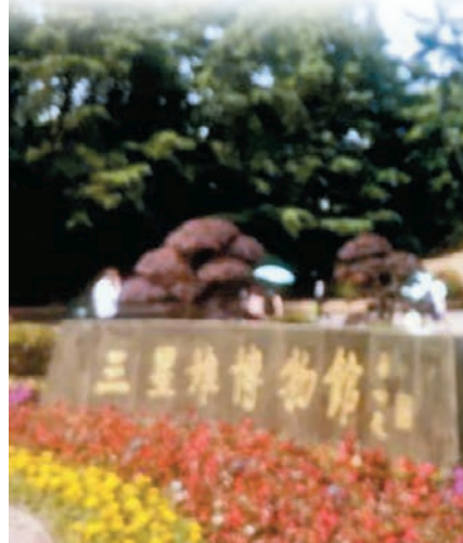
四川三星堆 青銅面具雪糕 網上圖片