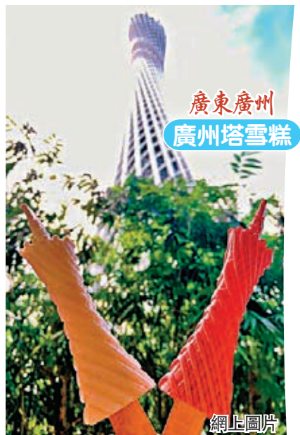
廣東廣州 廣州塔雪糕 網上圖片