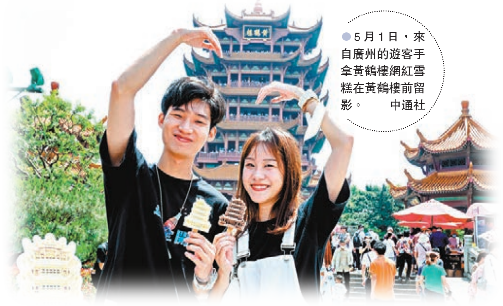
●5月1日，來自廣州的遊客手拿黃鶴樓網紅雪糕在黃鶴樓前留影。

「五一」小長假期間，位於四川省廣漢市的三星堆博物館再度成為熱門打卡地，假期首日便迎來1.5萬餘名遊客參觀。當日，一款由三星堆文創館推出的文創食品——「青銅面具」雪糕也火出了圈。「青銅面具」雪糕以三星堆祭祀坑出土的兩款青銅面具為原型打造，目前推出了「青銅味」(抹茶)和「出土味」(朱古力)兩種口味。5月1日，1,200多支「試水」的雪糕，在一個上午就銷售一空。據三星堆文創館的設計師介紹，未來還會陸續推出「青銅大立人」、「青銅鳥頭」等多款造型的雪糕，還將增加青檸、草莓等不同口味。造型獨特又極具新意，「青銅面具」雪糕一經推出即登上微博熱搜，網友們紛紛表示「坐不住了」。不少網友稱，為了吃到這款可愛的雪糕，一定要去打卡三星堆。