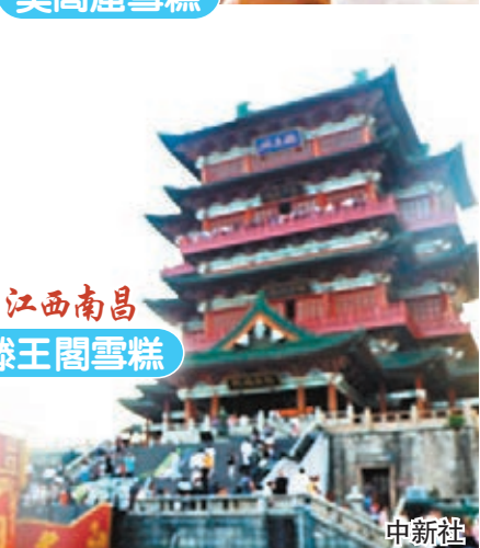
江西南昌 滕王閣雪糕 中新社