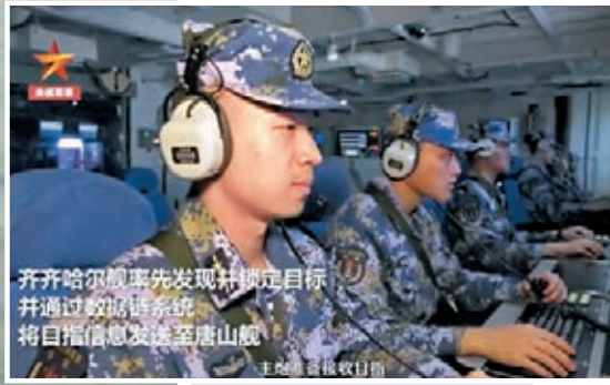
齊齊哈爾艦隊先發現并鎖定目標，通過數據鏈系統將目標信息發送至唐山艦。

◀近日，北部戰區海軍某驅逐艦支隊導彈驅逐艦編隊高強度海上練兵，連訓9晝夜，火力全開。圖為該實戰化訓練現場。視頻截圖