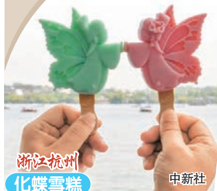
浙江杭州 化蝶雪糕