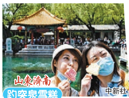
山東濟南 趵突泉雪糕