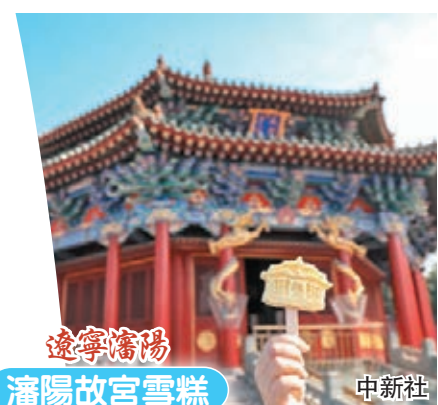
遼寧瀋陽 瀋陽故宮雪糕