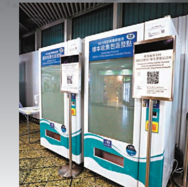
▲樣本收集包。

香港近日湧現「檢測潮」，多區社區檢測中心的檢測預約名額爆滿，檢測中心每日也出現長的人龍等候接受檢測。若不想在烈日下等候檢測，市民可以到全港20個港鐵站的自動派發機、醫管局指定的47間普通科門診診所索取樣本包。然而，有關派發點「一樽難求」，香港文匯報記者昨日奔波於多個港鐵站，發現樣本包大清早已被人掃空。