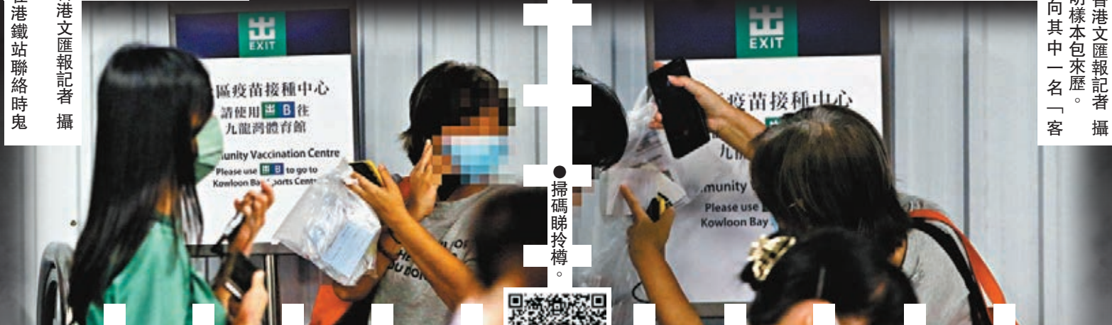
▲賣家在港鐵站聯絡時鬼