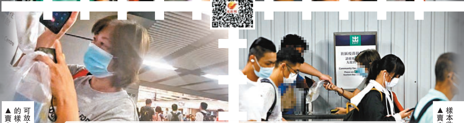
▲賣家聲稱在港鐵站領取 的樣本包，後才到期， 可放心使用。