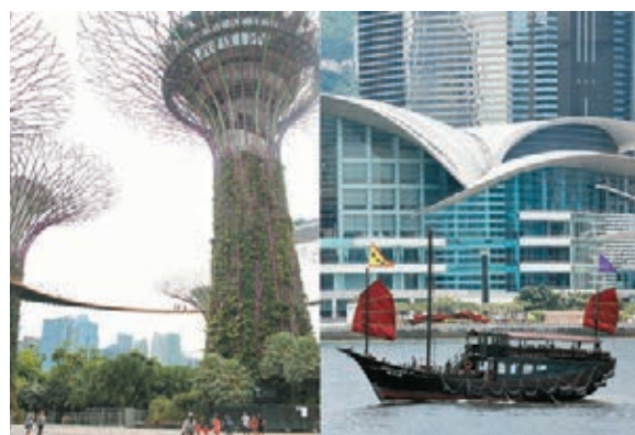
●新加坡疫情近日惡化，「旅遊氣泡」再添變數。圖為新加坡與香港兩地景點合成圖片。

香港文匯報訊(記者 高俊威)香港特區出現變種病毒傳播鏈，新加坡的本土個案亦回升至雙位數，或令兩地擬於本月26日啟動的「旅遊氣泡」再添變數。新加坡官員前日宣佈，今個星期六起即將收緊防疫措施，並正評估與香港的「旅遊氣泡」計劃是否有潛在