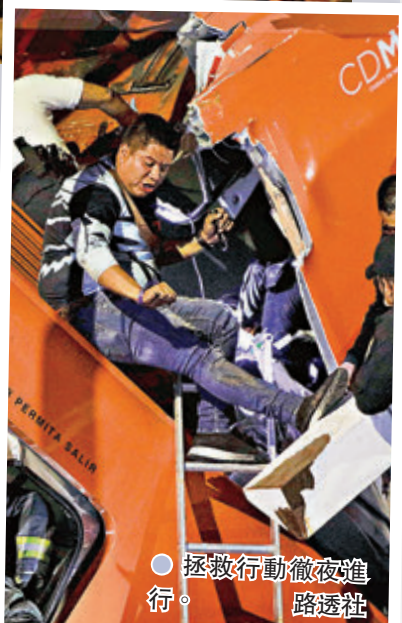
●拯救行動徹夜進行。