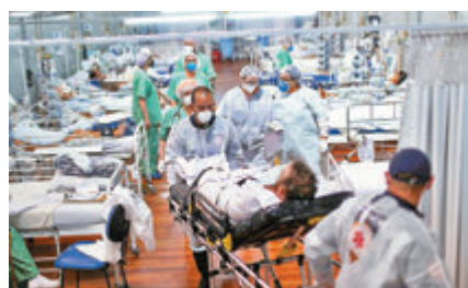
●巴西疫情出現年輕化跡象。

巴西的新冠疫情已造成逾40萬人死亡，超過1/3為59歲或以下人士，更有5%死者不足39歲，遠高於美國的1.5%及英國的0.64%，反映巴西疫情趨向年輕化。