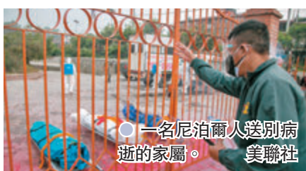
●一名尼泊爾人送別病逝的家屬。

目前尼泊爾已有逾200萬人，分別接種印度生產的阿斯利康疫苗或中國國藥疫苗，但上月因供應不足而暫停接種。一直被批評抗力不力的總理奧利前日發表電視演說，促請其他國家和國際組織，向尼泊爾供應疫苗和藥物，以免國