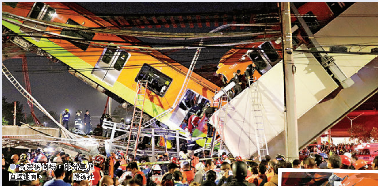
●高架橋倒塌，部分車廂直墜地面。

墨西哥首都墨西哥城前晚發生嚴重交通事故，一輛地鐵列車駛經高架路段時，高架橋突然坍塌，部分車廂墜落地面，造成至少23人死亡及約70人受傷。發生事故的地鐵線事後暫停運作，市長欣德姆下令調查肇事原因，並檢查有關路線設施的結構。