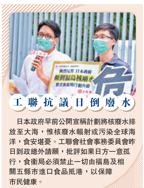
●香港文匯報記者 兩航

文件要求，「民陣」須於5月5日或之前以書面形式向警方提供6項資料，包括未再申請社團註冊的原因；「民陣」是否屬於《社團條例》附表所列的人；「民陣」社交專頁是否由「民陣」建立和管理；要求提供「民陣」由2006年9月至今曾舉辦的遊行集會資料；要求交代「民陣」成立以來的收入來源、開支、用作接收任何資金或款項的銀行及戶口號碼；要求「民陣」解釋與其他團體聯署致聯合國人權事務高級專員的聲明的目的及原因等等。