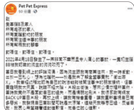
●「Pet Pet Express」突然道歉，俾網民質疑因為冇生意先跪低轉軟。

事隔兩星期後，當時口硬嘅「Pet Pet Express」老闆突然跪低，仲打咗篇千字文道歉，多次重複話「對唔住」，又聲言自己「因為狗主跟我有商業往來，我一時衝動，出於一己私心，想為他護航，於是未了解全盤事實就『衝出嚟×』」。佢又力數自己嘅直播期間嘅「四大罪狀」，包括自己嘅態度極唔人道、