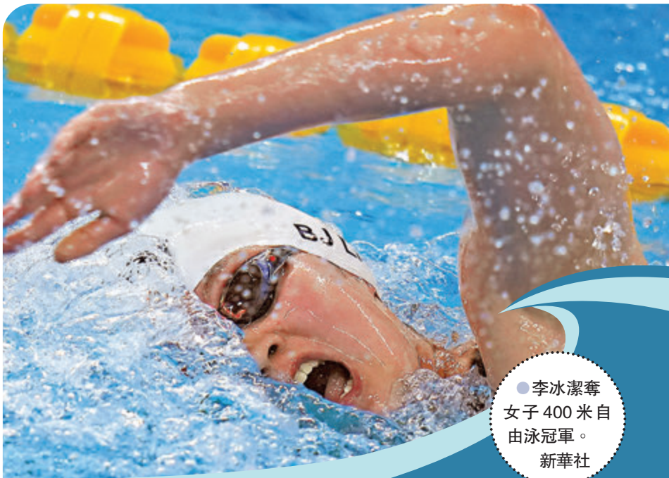
●李冰潔奪女子400米自由泳冠軍。