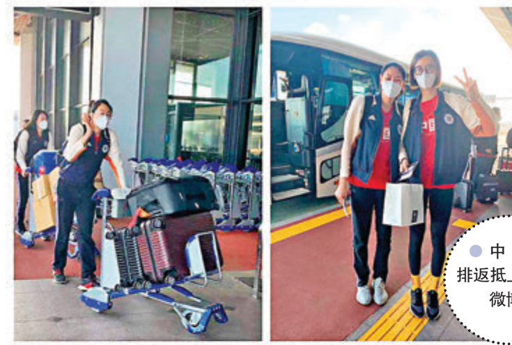
●中國女排返抵上海。

香港文匯報訊(記者 陳曉莉)時隔580天終於回歸國際賽場的中國女排,周日深夜由日本返抵上海浦東機場,她們將隔離14天,之後稍作調整,本月21日將再次啟程,出征在意大利舉行的世界聯賽。