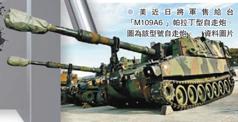
●美近日將軍售給台「M109A6」帕拉丁型自走炮。圖為該型號自走炮。資料圖片

背景：根據美國國務院發表的新聞聲明，這批M1A2坦克的配套彈藥是7,800多發KEW-A1鎢芯脫殼穿甲彈，它們的性能大致相當於上世紀九十年代服役的M829穿甲彈