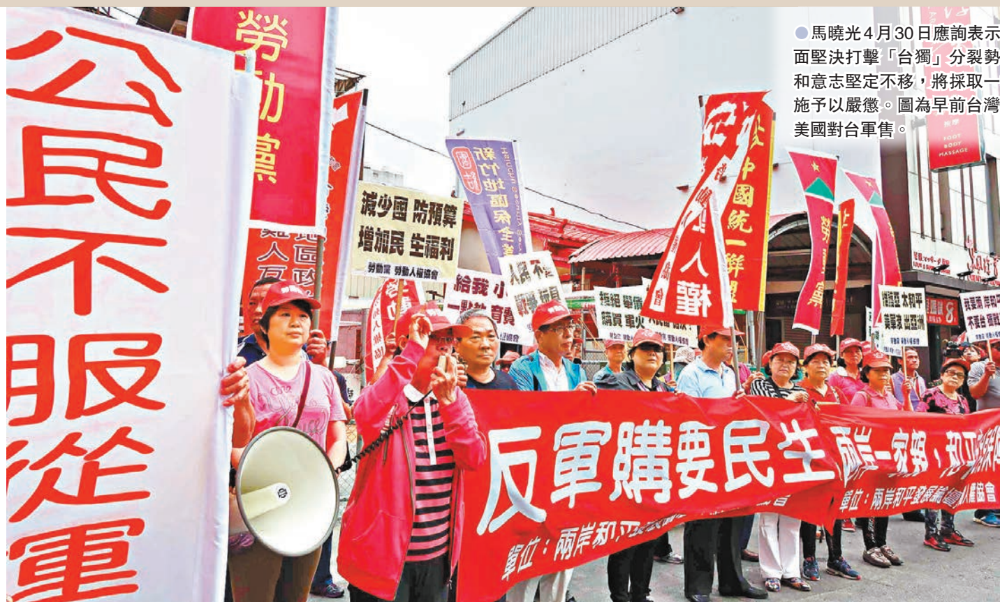
●馬曉光4月30日應詢表示，大陸方面堅決打擊「台獨」分裂勢力的決心和意志堅定不移，將採取一切必要措施予以嚴懲。圖為早前台灣民眾抗議美國對台軍售。資料圖片