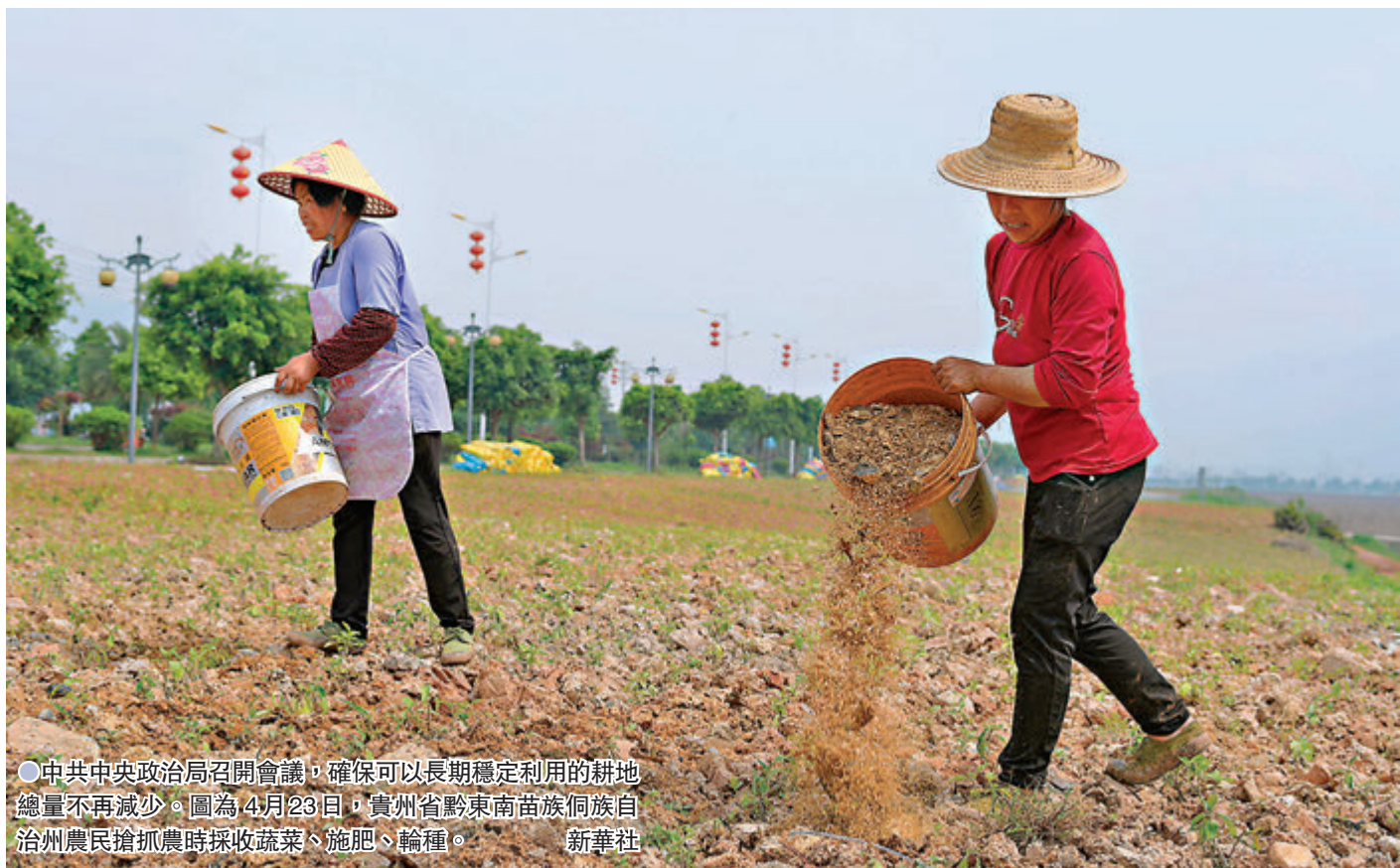
●中共中央政治局召開會議，確保可以長期穩定利用的耕地總量不再減少。圖為4月23日，貴州省黔東南苗族侗族自治州農民搶收農時採收蔬菜、施肥、輪種。新華社

香港文匯報訊 綜合新華社及中新社報道，中共中央政治局4月30日召開會議。中共中央總書記習近平主持會議。會議聽取第三次全國國土調查主要情況匯報，審議《中國共產黨組織工作條例》。會議強調，要堅持最嚴格耕地保護制度，優化調整農村用地布局，確定各地耕地保有量和永久基本農田保護任務，規範耕地佔補平衡，確保可以長期穩定利用的耕地總量不再減少。會議強調，做好新時代組織工作，要堅持以習近平新時代中國特色社會主義思想為指導，堅持組織路線為政治路線服務，把黨的領導貫徹到組織工作各方面全過程。