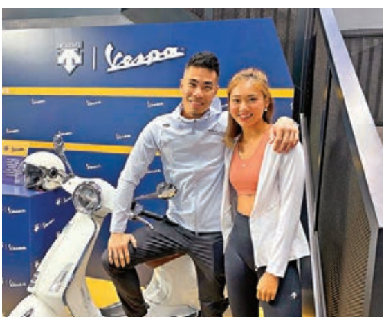
●DESCENTE TRAINING & DUALIS夏日系列

今次聯乘系列取用運動品牌BLEU騎行生活系列的基礎，並整合從VESPA歷史中的當代經典車款，兩者結合並作為聯乘設計的主要元素，在