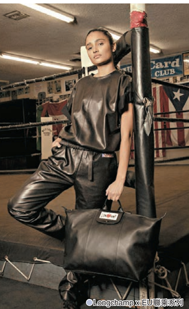
●Longchamp x EU聯乘系列