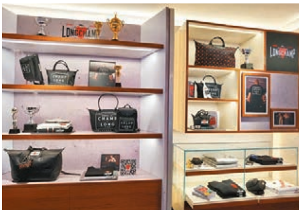
●位於中環的Pop-up Store展示全新聯乘系列