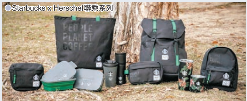
●Starbucks x Herschel聯乘系列

系列中的所有背包、手提袋和配件以95%環保再生PET物料和5%咖啡渣製成，而隨行杯當中的Starbucks x Herschel Supply Co. 16oz可重用隨行杯亦採用咖啡渣和循環再造塑膠製成。系列以低調神秘的黑色和星巴克品牌綠色為主調，並印有兩個品牌的黑白標誌，以及宣揚環保的訊息，引領環保時尚的個性風格。