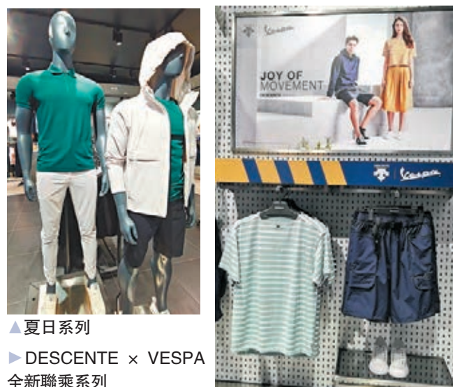
▲夏日系列 ▶DESCENTE x VESPA全新聯乘系列

今年在疫情下，多了市民做運動，運動服裝品牌就搞搞新意思，與其他品牌及設計師合作，不少品牌跨界推出聯乘系列，結合運動科技元素以及潮流的角度設計，包羅各種時裝及手袋等，將現代休閒共冶一爐，既舒適又時尚。