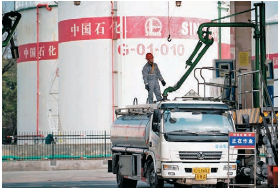
●中國石化今年首季業績虧轉盈。以國際會計準則計算,盈利達185.43億元人民幣。首季油氣當量產量1.17億桶,增長4.2%。

期內勘探及開發板塊息稅前利潤30.72億元,增長54.1%。公司指出,期內持續加強高質量勘探和效益開發,加快天然氣產供儲銷體系建設,穩油增氣降本取得新進展。 煉油方面,首季原油加工量6,252萬噸,增長16.3%。有關板塊的息稅前利潤198.85億元,不僅扭虧,亦高於2019年