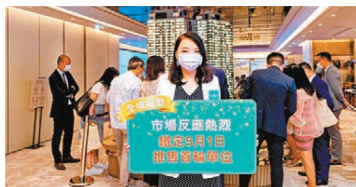
● 封海倫預計大手買家看好港島南鐵路盤的優厚潛力，打算購買多個單位用作長線投資。