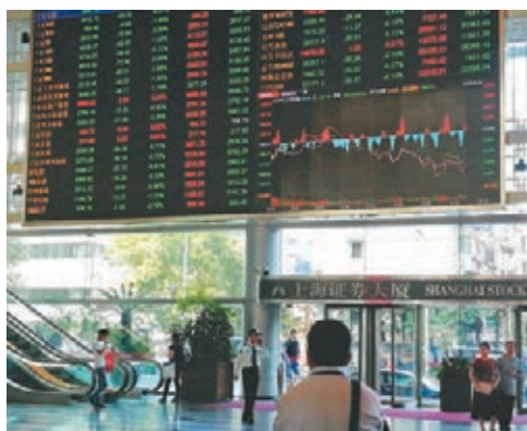
● 滬指昨收報3,457點，漲14點。資料圖片

不少機構預計，節前市場應當難有大行情。光大證券指，長假後市場將進入一季報後的業績空窗期，機構重倉股在持續反彈後壓力增加，但博奕加劇不改整體緩慢修復趨勢，投資者所期待的超預期變化因素出現前，平靜期的市場料將波瀾不驚。