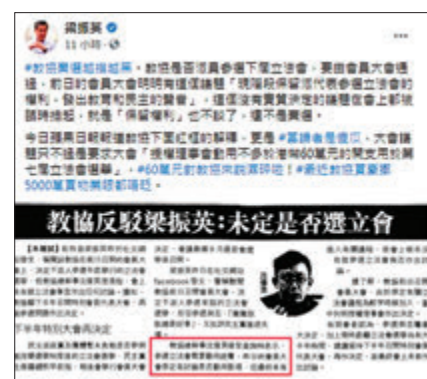
●梁振英批評教協對參選的取態越描越黑。

他並指,昨日《蘋果日報》報道教協的解釋,「教協總幹事沈偉傑接受查詢時表示,參選立法會需要動用經費」,並聲稱會員大會原定有討論是否動用款項,但最終未有進入有關程序等。梁振英指,相關解釋是當讀者是傻瓜,大會議題只不過是要求大會「授權理事會動用不多於港幣60萬元的開支用於第七屆立法會選舉」,「60萬元對教協來說濕碎啦,最近教協豪擲5,000萬買物業眼都不眨。」