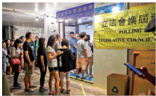
●本港維持5個立法會地方選區逾20年,但歷史上地方選區的劃分也曾出現數次改動。圖為2016年立法會選舉,市民輪候投票。 資料圖片