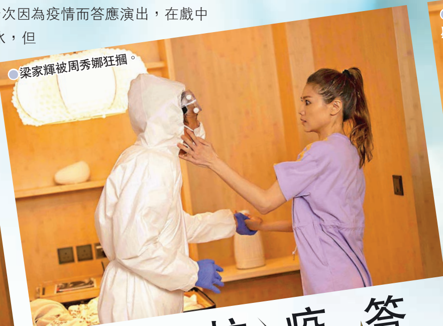
●梁家輝被周秀娜狂摑。