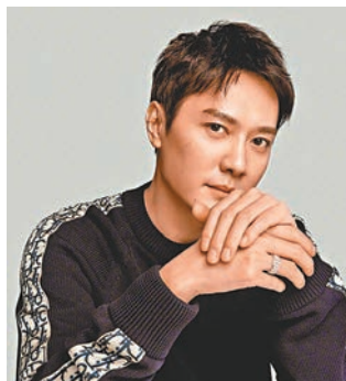
●馮紹峰呼籲廣大公眾共同維護健康文明的網絡文化環境。

據分析指，這次趙麗穎與馮紹峰結束婚姻關係，外界的輿論普遍是支持，並且傾向於趙麗穎一方，原因大概也是覺得馮紹峰配不上趙麗穎。可是論家庭背景，馮紹峰家境殷實，男方比女方要好得多，學歷上亦較女方高，不過，真正因為趙麗穎無深厚背景，卻獨自闖蕩成為85後小花的代表，可以說是勵志女王的代表，但為了跟馮紹峰結婚生子而一度暫停演藝事業，讓很多人覺得不值得。