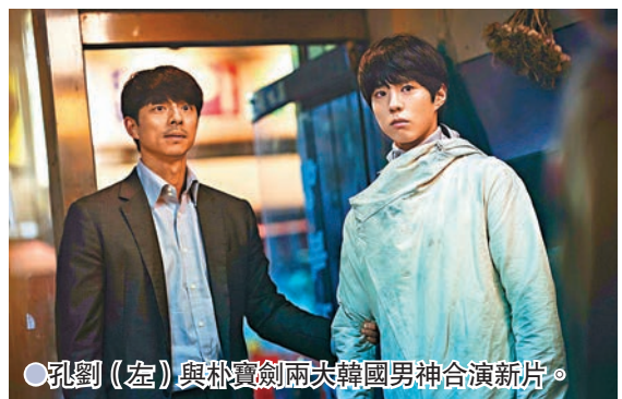
●孔劉(左)與朴寶劍兩大韓國男神合演新片。

綜合中央社報導 韓國男星孔劉、朴寶劍主演的電影《複製人徐福》已在港上映，談起過去常在作品中飾演「守護者」角色，孔劉接受電影公司訪問時笑說其