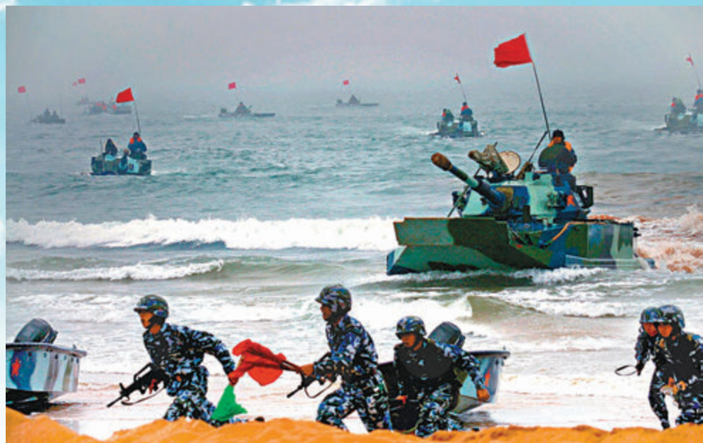
●「轉型」是當下人民海軍建設發展的一大關鍵詞。圖為早前參加軍事演習的海軍陸戰隊官兵搶佔灘頭陣地。

軍建設發展的一大關鍵詞。「轉型」是當下人民海軍、綜合防禦作戰等方面的能力。「轉型」是當下人民海軍、綜合防禦作戰等方面的能力。「轉型」是當下人民海軍、綜合防禦作戰等方面的能力。「轉型」是當下人民海軍、綜合防禦作戰等方面的能力。「轉型」是當下人民海軍、綜合防禦作戰等方面的能力。