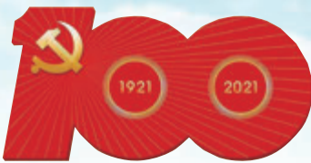
慶祝中國共產黨成立100周年 特別報道