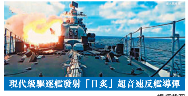
現代級驅逐艦發射「日炙」超音速反艦導彈 視頻截圖