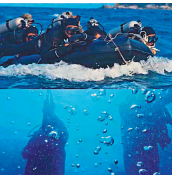
●近年來，中國海軍加快由近海防禦型向遠海防衛型轉變，不斷提高戰略威懾與反擊、海上聯合作戰、綜合防禦作戰等方面的能力。 視頻截圖