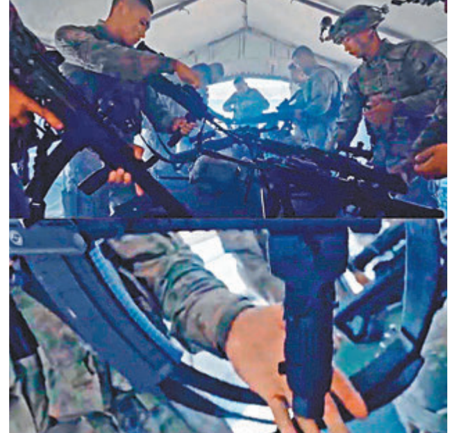
新型步槍、高精狙擊步槍、新一代衝鋒槍 視頻截圖