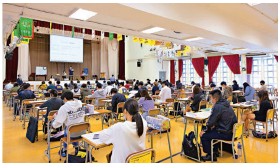
●中學文憑試昨日正式開鑼，首科為視覺藝術科。

香港文匯報訊(記者 郭虹宇)中學文憑試昨日正式開鑼，首科為視覺藝術科。在疫情下，本身是試場的屯門青松侯寶垣中學因有學生屬新冠肺炎個案密切接觸者，校舍昨日需要消毒，48名考生前日(22日)獲通知轉往屯門官立中學應考。位於洪水橋的天主教崇德英文書院亦因有初三女生確診，考場要停用，有50多名考生要轉到屯門舊色園主辦可藝中學應考。有考生對要轉換試場或感到緊張，有人更要改乘的士趕赴考場。