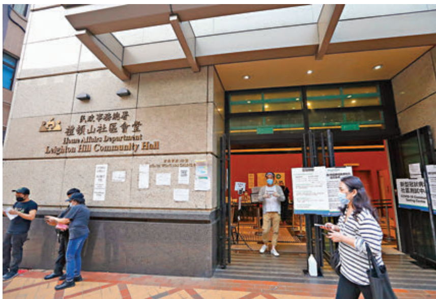
●該名外傭曾在禮頓山社區會堂檢測站檢測。

昨晚約8時30分，政府圍封海怡半島10座進行強制檢測，預計今天上午8時完成行動。大樓內如有應屆文憑試考生，政府建議考生盡早前往受限區域內的臨時採樣站，證明其考生身份後，可獲優先檢測。