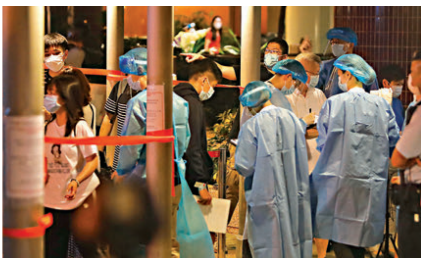
●昨晚八時封區強檢港島南區海怡半島第十座，居民陸續接受採樣。