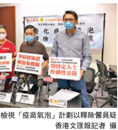
●工聯會要求政府檢視「疫苗氣泡」計劃以釋除僱員疑慮。

張宇人昨日先後與飲食、酒吧和夜總會等業界與政府官員面。他在會後透露，食肆若希望放寬營業時間到午夜12時及每枱人數上限增至6人，所有員工須接種第一劑疫苗。酒吧、夜總會和卡拉OK復業的前提是必須顧客與員工均已接種疫苗。如飲食業員工因健康理由而不能接種疫苗，可選擇作出申報，並須填寫不接種聲明，毋須經營生證明，但員工要就聲明負責，並定期接受檢測，以換取食肆在「疫苗氣泡」下放寬防疫措施。