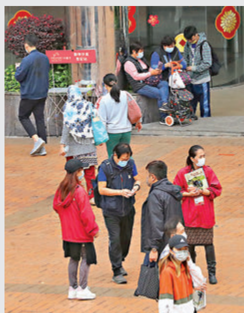
▶籌款街站設有易拉架，不會有執法人員票控「阻街」。