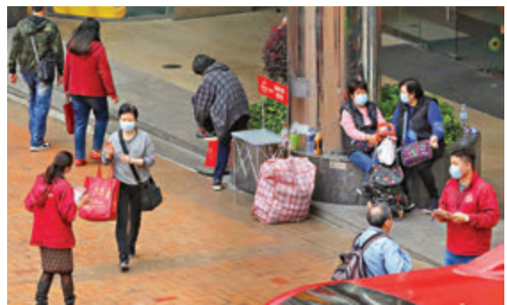
●街頭籌款活動「無王管」。

由於在街頭籌款活動中，市民若捐款10元，最終七除八扣後可能只有兩三元真正用於受助者身上。受訪者被問及若每捐出10元，至少應有多少捐款應用在受助者身上時，約83.3%受訪者認為至少應要有8元，更有37%受訪者認為應將所有捐款用於受助人之上，接受不足5元者僅得5.21%。