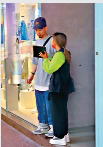
▶籌款員經常食檸檬，並會被組長黑臉。

他建議專職監管慈善籌款活動的法例應包括要求披露善款，不能作誇大甚至失實的陳述，以避免不透明作業。