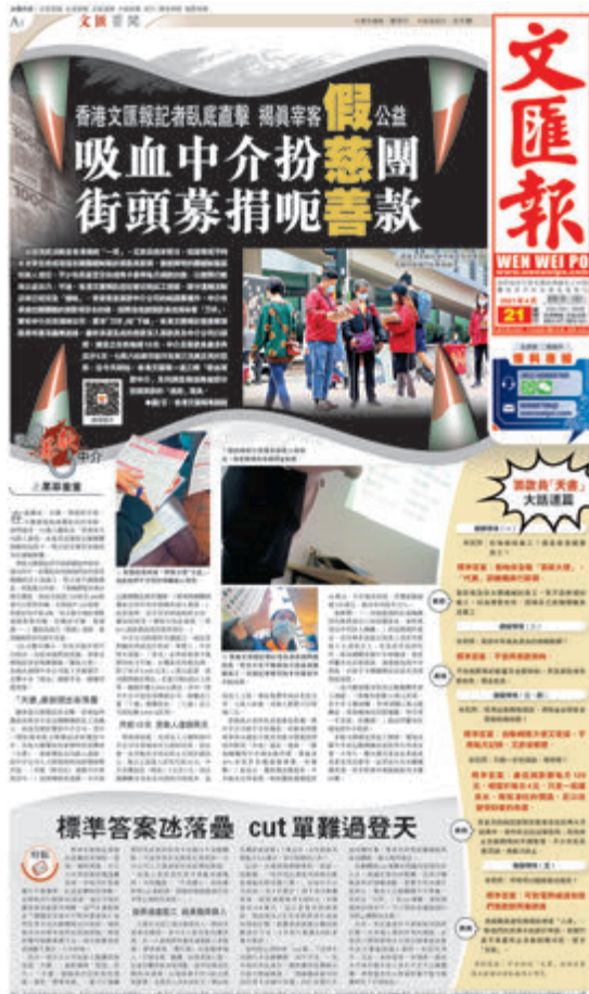
●香港文匯報一連三天報道踢爆中介公司瓜分大比例捐款。