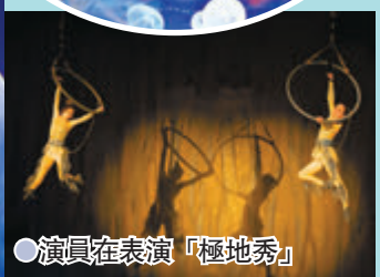
演員在表演「極地秀」