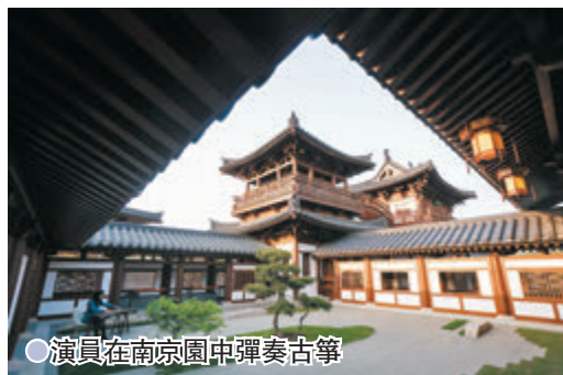
演員在南京園中彈奏古箏

藝是一次現代建造技術與傳統古建造型相結合的大膽嘗試，其城市展園片區集合了江蘇十三市地理人文和傳統園林特點，是江蘇園林文化和園林技藝的集成表達。