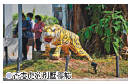
香港虎豹別墅標誌

當年，虎豹別墅樓高4層，連同花園佔地共2,000平方米，大宅正門屬月洞門，可將私人花園及原有的萬金油花園的翠綠景致引入室內，地下為客廳、飯廳、閱讀室、