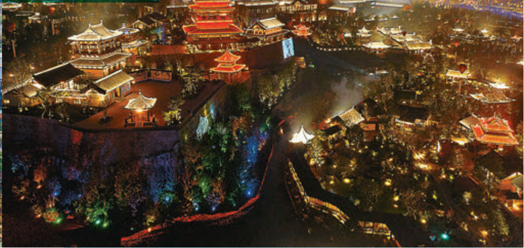
從這個角度看，園林景觀尤美。