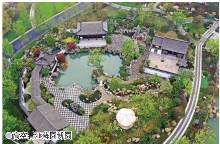
高空看江蘇園博園

寶華山、湯山四個風景區環抱園內，密林鬱葱、生態多樣，石灰石礦產尤為豐富；有254萬平方米園林景觀、31萬平方米形態各異的特色房建、24.3公里市政軌道交通。位於南京市江寧區的江蘇園博園項目由一個標誌性建築、兩大光智工程三大形象入口、四大精美花谷五大精品酒店、六大配套設施組成，融合古建、園林景觀、市政、生態治理多種業態，與礦坑修復、超大異形曲面結構等多重難題相遇，同時還肩負着深入貫徹新發展理念，堅持生態優先、綠色發展，打造江蘇踐行「兩山」理論標誌性樣板的使命。