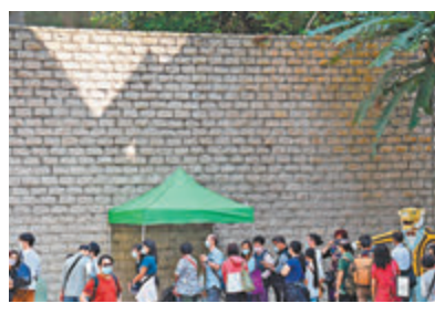
早前開放日大批市民排隊入內參觀

位於大坑大坑道的香港虎豹別墅，是已故商人胡文虎在1936年建造的一座別墅及花園，鄰近勵德邨住宅群，現被列為一級歷史建築。虎豹別墅屬中式文藝復興建築風格，糅合中西建築方法及理論，毗連的萬金油花園亦是眾多香港人的集體回憶。在2011年，胡文虎慈善基金會及虎豹音樂基金會有限公司獲得香港特區政府活化歷史建築伙伴計劃的支持，將虎豹別墅活化成為虎豹樂園，早前首次舉行開放日，毋須預約入場，吸引數百名市民排隊2至3小時等候入場參觀。