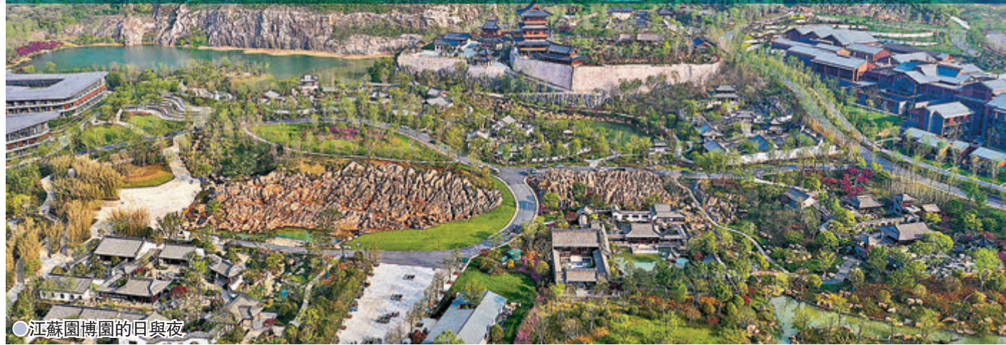
江蘇園博園的日與夜