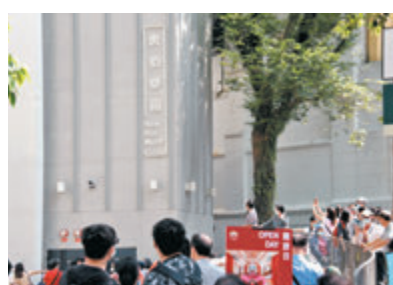
活化後的虎豹樂園