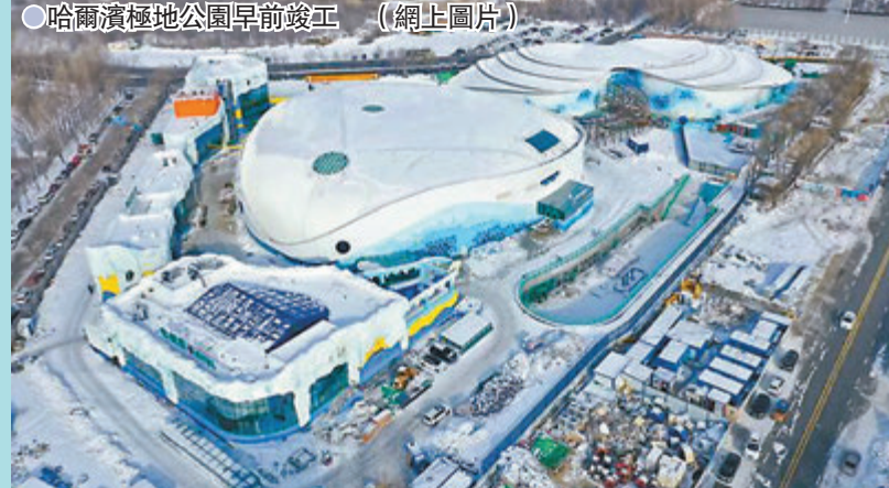
哈爾濱極地公園早前竣工 (網上圖片)