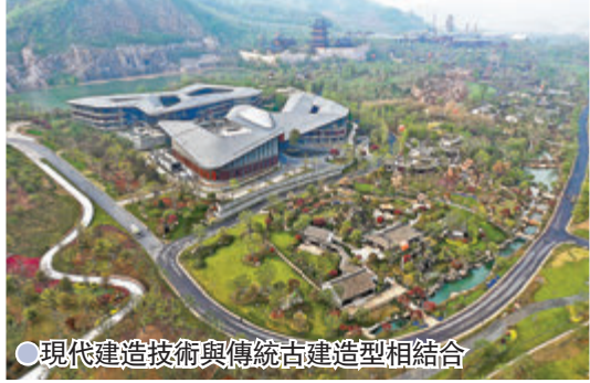
現代建造技術與傳統古建造型相結合