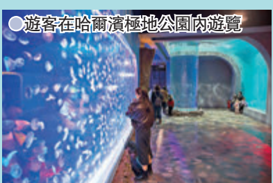
遊客在哈爾濱極地公園內遊覽

江蘇園博園項目於2018年7月正式啟動，由中國工程院院士崔愷、王健國設計，導演陳維亞擔任藝術總顧問，項目原址為龍泉採石場，主展館由兩家廢棄水泥工廠改造而成，還建有13個城市展園。江蘇園博園已於2020年底完成建設，由即日起至5月16日，第十一屆江蘇省園藝博覽會將在此舉行，博覽會結束後項目建築將繼續保留。