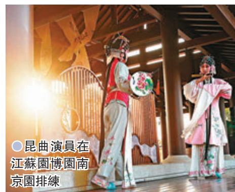
昆曲演員在江蘇園博園南京園排練