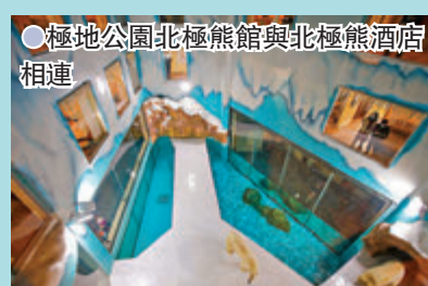
極地公園北極熊館與北極熊酒店相連