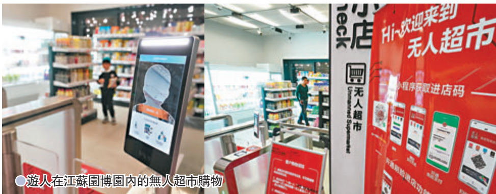
遊人在江蘇園博園內的無人超市購物