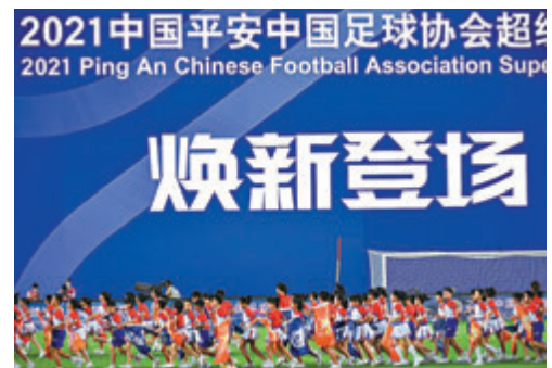
●中國職業足球煥新登場。