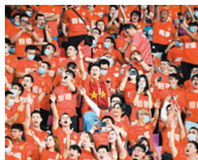
●近3萬名球迷進入天河體育場。

將球打入自家球門，比分變成1:1。最終，雙方2:2握手言和，能在廣州隊魔鬼主场拿走1分，對廣州城來說算是一個比較滿意的結果。