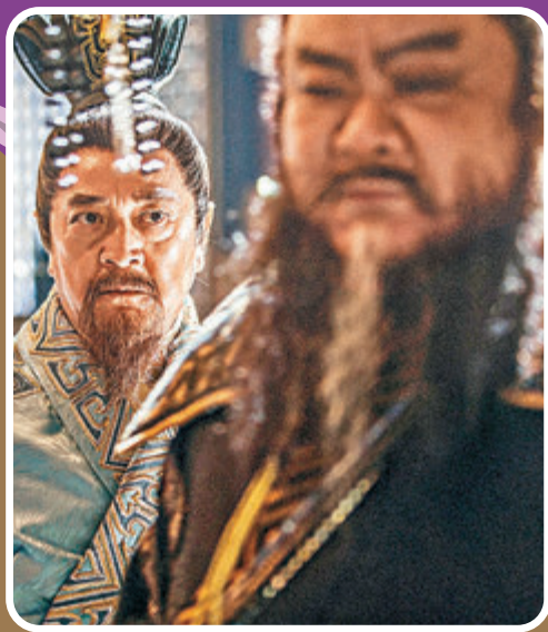
●秦沛(左)相隔12年再演古裝片。