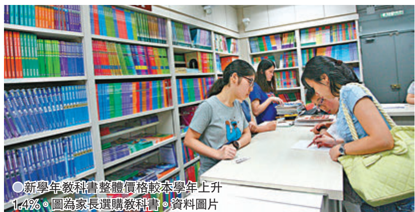
●新學年教科書整體價格較本學年上升1.4%。圖為家長選購教科書。資料圖片

教育局首席教育主任（課程發展）謝婉貞昨日在教育局網上專欄《局中人語》中撰文，提到教育局「適用書目表」網頁（www.edb.gov.hk/rti）公布了新學年課本價格。她表示，本港經濟受疫情嚴重打擊，連帶教科書營運同樣受到衝擊，但仍呼籲出版社繼續履行企業社會責任，與家長共度時艱，盡量克制課本定價，並得到大部分出版社正面回應，最終下學年有近四成半課本凍價甚或減價，其餘加幅仍屬溫和。整體而言，來年印刷及電子課本價格較本學年上升1.4%。