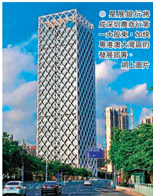
●星展銀行將成深圳農商行第一大股東，加快粵港澳大灣區的發展部署。

香港文匯報訊(記者周曉菁)星展集團加快粵港澳大灣區的發展部署，旗下子公司星展銀行昨宣布，將以52.86億元(人民幣，下同)的價格，收購深圳農村商業銀行約13.5億新股。交易完成後，星展銀行將成為深圳農商行第一大股東，並擁有董事會席位。星展集團執行總裁高博德表示，藉此合作，星展將在大灣區加倍發展，未來若有機會，還將考慮增持股份。