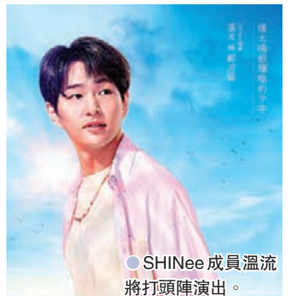
● SHINee 成員溫流將打頭陣演出。