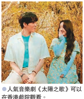
● 人氣音樂劇《太陽之歌》可以在香港戲院觀看。