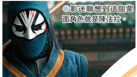
● 影迷聯想到這個蒙面角色就是陳法拉。

梁朝偉在電影中飾演「尚氣」的父親「文武」，也就是在漫畫中的「滿大人」，他是鐵甲奇俠難纏的勁敵，本身是一位武術大師，窮究武術奧秘，並已掌握了「氣」，可徒手拆掉鐵甲奇俠的裝甲，