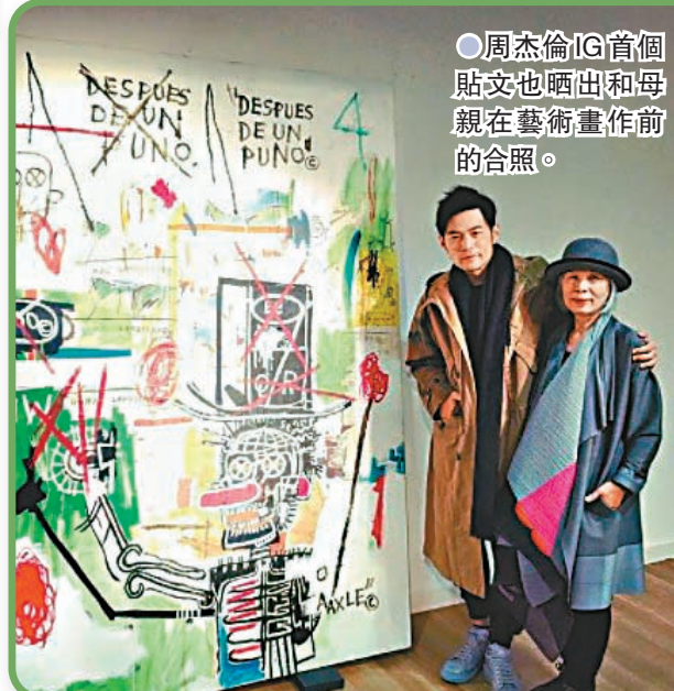
● 周杰倫IG首個貼文也晒出和母親在藝術畫作前的合照。

周杰倫向來對藝術領域充滿興趣，他於2017年開設IG賬戶，首個貼文就是和母親在美國藝術家巴斯基亞（Jean-Michel Basquiat）畫作前的合照。之後，巴斯基亞的作品亦不時出現在周杰倫的社交網上，例如周杰倫