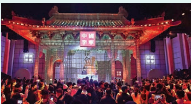
● 中國李寧21秋冬潮流發布

打造的一座有21個劇場的戲劇幻城，佔地622畝，目前正在籌備開業。這次李寧大秀亮相的幾個空間，也只是揭開了幻城「紅蓋頭」的小小一角。待到全面綻放之時，《只有河南》必將為河南文旅行業發展注入新新動力。