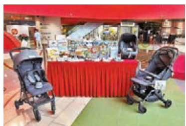
● BB兒童購物展於MegaBox舉行

由4月23日至25日，全港首個商場舉辦大型BB展「MegaBox BB兒童購物展」，近20間兒童物品商戶及品牌將分別於多個商場展銷場地及店內提供驚喜優惠，數萬件精選嬰兒用品、玩具、童裝及兒童傢俱低至3折發售，應有盡有！參與商戶名單陣容鼎盛，包括AEON、荷花親子、mothercare、La Compagnie des Petits、雅芳婷床褥等，未能盡錄！