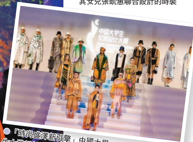
● 「時尚盛澤新引擎」中國大學生女裝設計大賽優秀作品發布秀