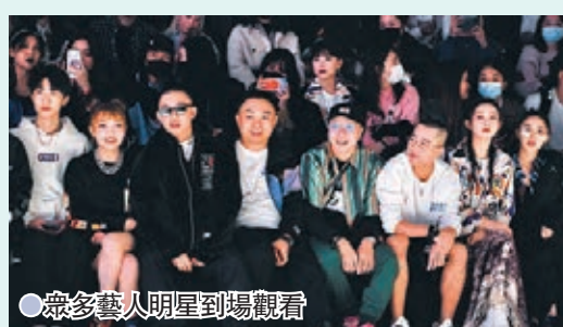
● 眾多藝人明星到場觀看

打造的一座有21個劇場的戲劇幻城，佔地622畝，目前正在籌備開業。這次李寧大秀亮相的幾個空間，也只是揭開了幻城「紅蓋頭」的小小一角。待到全面綻放之時，《只有河南》必將為河南文旅行業發展注入新新動力。