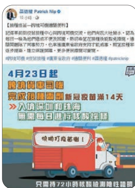
●聶德權期望接種率提高。

聶德權指出，通關問題除了特區政府努力，也幸獲廣東省政府支持才能成事，期望接種率逐步提高，令更多便民措施可以實施。 他續說，目前已有約80%活躍跨境貨車司機接種了兩劑新冠疫苗，呼籲仍未接種的司機盡快行動，以享受接種疫苗帶來的通關方便。