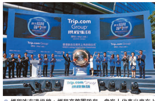
●攜程昨在港掛牌，攜程高管團隊與一眾客人代表出席在上海舉行的上市儀式。

香港文匯報訊（記者 岑健樂）攜程（9961）昨日首日掛牌上市，股價表現良好。該股昨開報281元，較招股價268元，升13元或4.85%，隨後高低位分別是281.2元與275.2元。該股最終收報280.2元，升12.2元或4.55%。以一手50股計算，投資者一手賬面獲利610元。