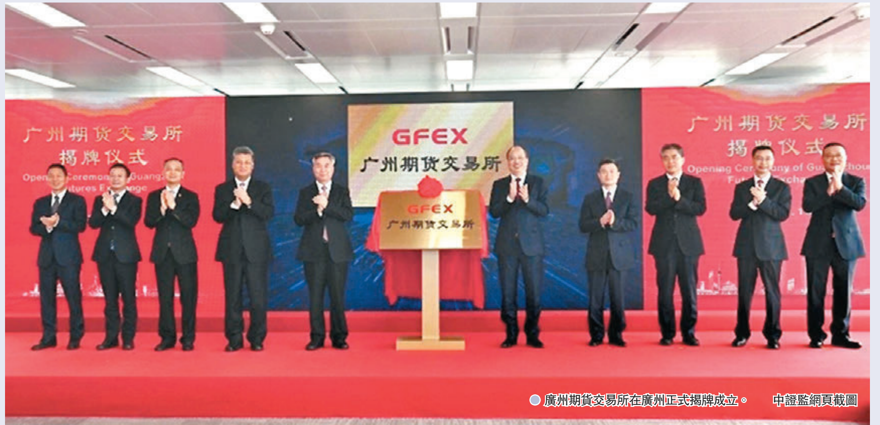
●廣州期貨交易所在廣州正式揭牌成立。

《粵港澳大灣區發展規劃綱要》中明確提出支持廣州建設綠色金融改革創新試驗區，研究設立以碳排放為首個品種的創新型期貨交易所。今年1月22日，經國務院同意，中國證監會正式批准設立廣州期貨交易所。昨日，廣東省書記李希、中國證監會主席易滿共同為廣期所揭牌，廣期所的工商登記手續也已正式完成。根據最新工商登記材料，廣期所成立於2021年2月5日，註冊資本為30億元（人民幣，下同），註冊地為廣州市南沙區，共引入八名股東，包括證監會管理的四家期貨交易所，以及廣東國資企業、民營企業和境外企業。