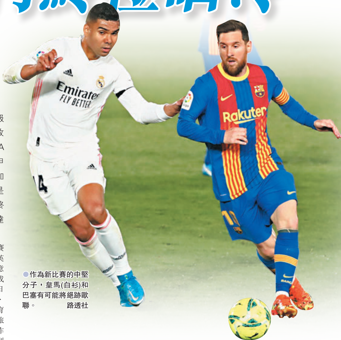
●作為新比賽的中堅分子，皇馬(白衫)和巴塞有可能將絕跡歐聯。

歐洲足壇將要面臨一次翻天覆地的大改變！早在2018年已傳出風聲，由豪門牽頭另起爐灶的「歐洲超級聯賽」正式拍板，脫離歐洲足協(UEFA)的歐洲聯賽冠軍盃(歐聯)及歐霸盃系統，另辦一個最高水平的超級盃賽，以爭取對他們認為是更公道的收益，同時亦有利他們鞏固強者地位。UEFA和國際足協(FIFA)都發聲明抗議，重申相關歐超聯初始的12家球會將被禁止參加現行賽事。看來，「12豪門」今次似乎是來一舖「晒冷」，要同UEFA進行一次終極博弈。 ●香港文匯報記者 梁志達