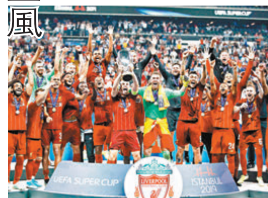
●2018/19賽季，會否已是利物浦最後一次登上歐聯頒獎台呢？

以此推之，今次博弈很大機會以UEFA讓步同意改革而結束；否則，沒有了眾豪門參與的歐聯，最終只會逐步走向消亡。