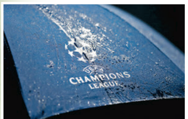
●假如12豪門最終真的脫離歐聯，勢將令這項歷史悠久的賽事逐漸消亡。