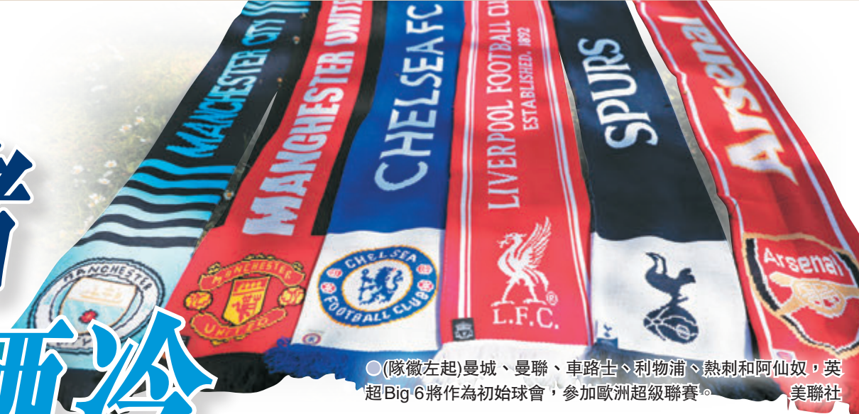
●(隊徽左起)曼城、曼聯、車路士、利物浦、熱刺和阿仙奴，英超Big 6將作為初始球會，參加歐洲超級聯賽。

歐洲足壇將要面臨一次翻天覆地的大改變！早在2018年已傳出風聲，由豪門牽頭另起爐灶的「歐洲超級聯賽」正式拍板，脫離歐洲足協(UEFA)的歐洲聯賽冠軍盃(歐聯)及歐霸盃系統，另辦一個最高水平的超級盃賽，以爭取對他們認為是更公道的收益，同時亦有利他們鞏固強者地位。UEFA和國際足協(FIFA)都發聲明抗議，重申相關歐超聯初始的12家球會將被禁止參加現行賽事。看來，「12豪門」今次似乎是來一舖「晒冷」，要同UEFA進行一次終極博弈。 ●香港文匯報記者 梁志達