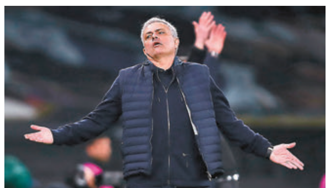
●摩連奴遭熱刺炒帥。