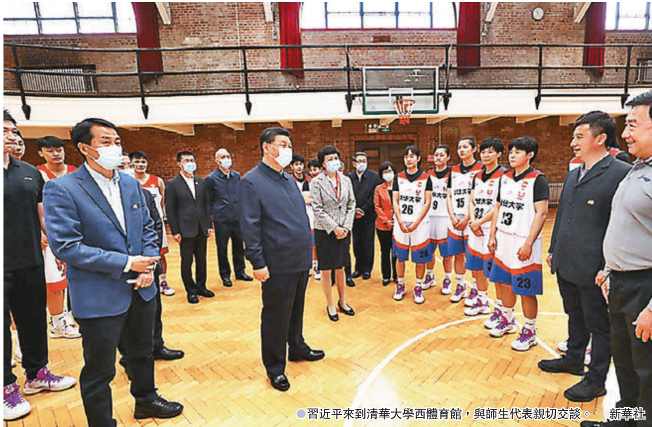
●習近平來到清華大學西體育館，與師生代表親切交談。

清華大學成像與智能技術實驗室成立於2001年，主要開展計算攝像、腦科學與人工智能國際前沿交叉科學等基礎理論與關鍵技術的研究。習近平來到這裏，結合展板、電子屏幕觀看實驗室開展計算光學、腦科學與人工智能交叉科學實驗研究和開發新科技應用場景情況，聽取實驗室理論