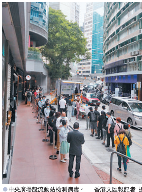
●中央廣場設流動站檢測病毒。