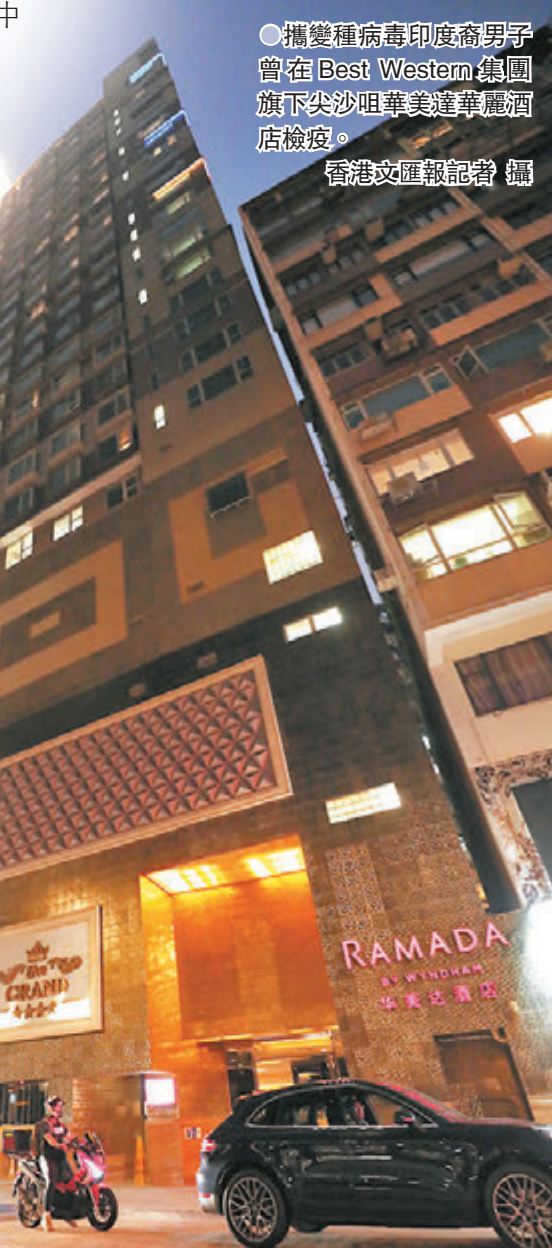
●攜變種病毒印度裔男子曾在 Best Western 集團旗下尖沙咀華美達華麗酒店檢疫。

不過，政府專家顧問、中文大學呼吸系統科講座教授許樹昌認為，確診男子潛伏期遠超 21 天，情況雖然少見，但相信檢疫酒店感染機會並不高，因為酒店通風系統未發現有問題。