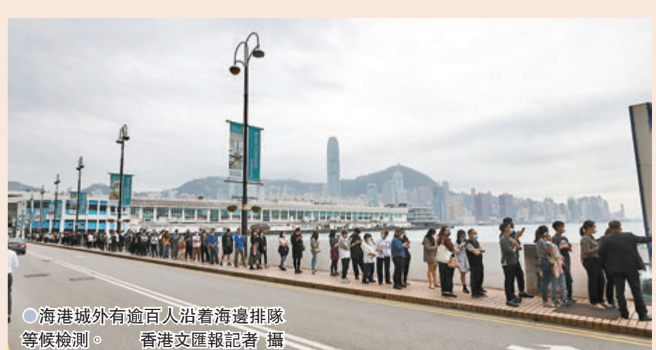
●海港城外有逾百人沿着海邊排隊等候檢測。