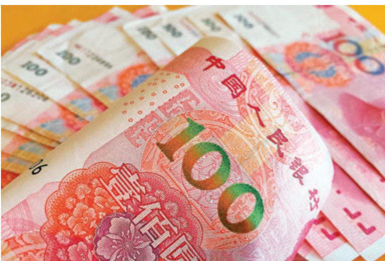
●華融事件打擊市場信心，令市場對內地債務危機憂慮進一步升溫。不過，中資債券仍受資金充裕及經濟復甦兩大因素利好。