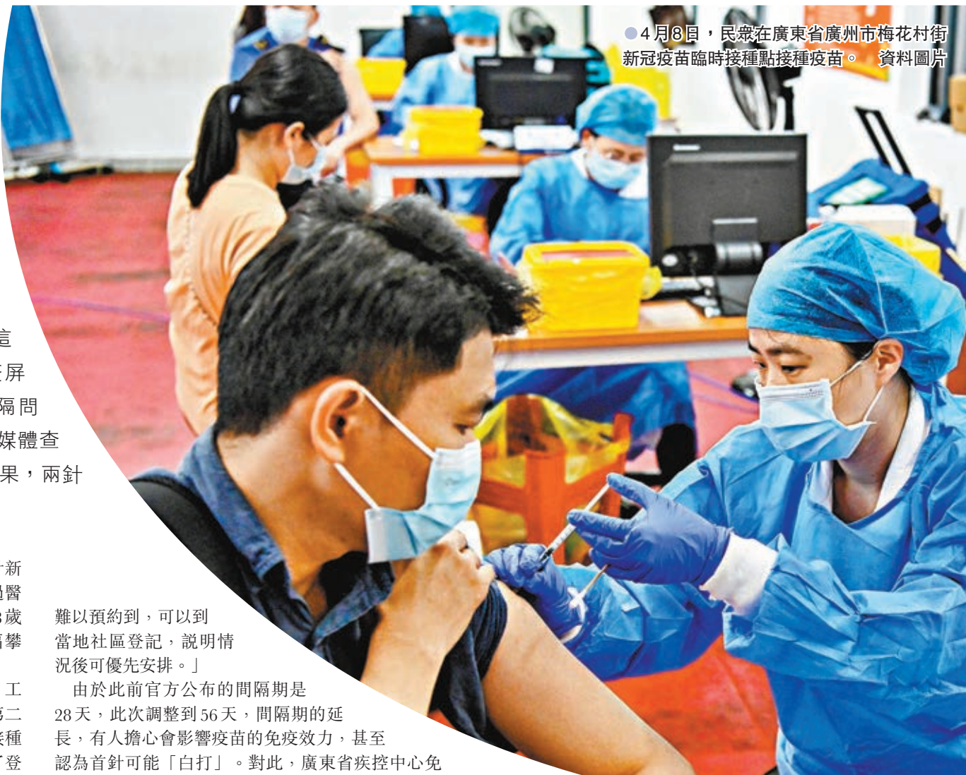
●4月8日,民眾在廣東省廣州市梅花村街新冠疫苗臨時接種點接種疫苗。資料圖片