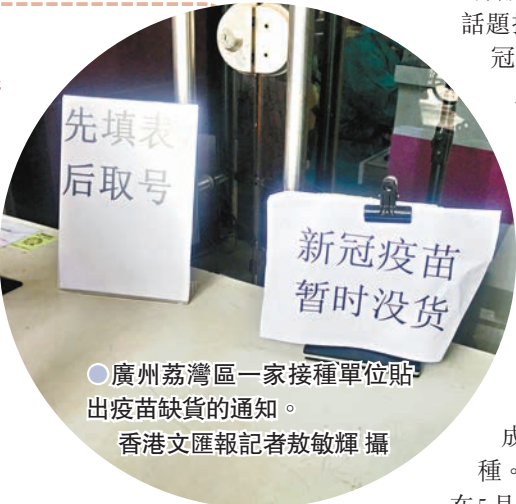
●廣州荔灣區一家接種單位貼出疫苗缺貨的通知。