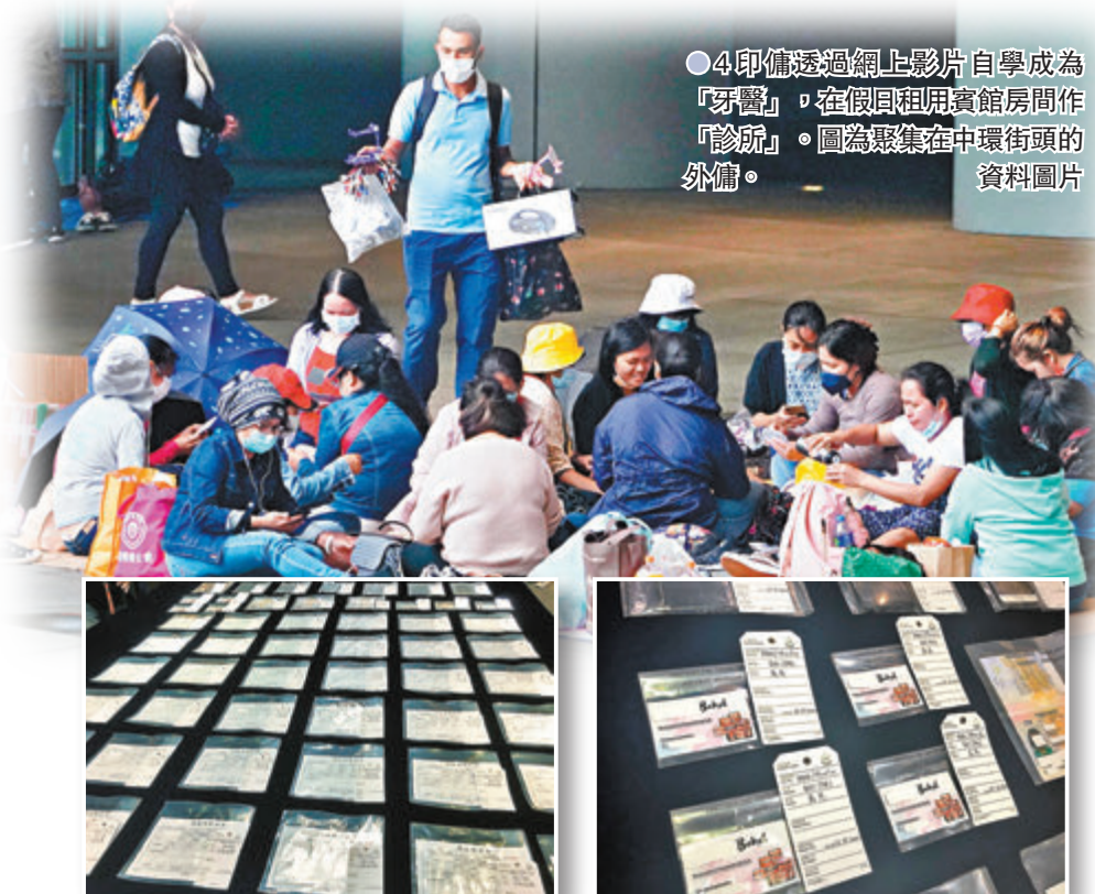
●4印傭透過網上影片自學成為「牙醫」，在假日租用賓館房間作「診所」。圖為聚集在中環街頭的外傭。

入境處打擊黑工向來不遺餘力，4名印傭竟透過網上影片自學成為「牙醫」，過去逾一年持續在假日租用旺角一間賓館的房間作「診所」，為同鄉提供洗牙、補牙及鑲牙等牙科療程，入境處接獲市民舉報後以涉嫌違反逗留條件在前日及昨日採取行動將他們拘捕，至於他們從事無牌牙醫工作的問題則會轉介其他部門跟進。數字顯示，外傭從事非法工作的情況有惡化趨勢，入境處於今年首3個月拘捕的272名非法勞工中，逾20%(57人)為外傭，比率較去年全年不足15%高，單季數字更已經迫近去年全年總數120人的一半。