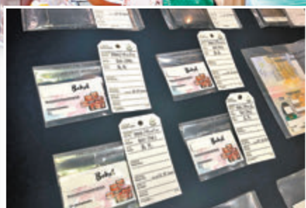
●無牌牙醫會以卡片宣傳。

入境處昨日表示，接獲市民舉報後開始就事件展開調查，最終於前日起一連兩天到4名年齡介乎31歲至35歲涉案印傭的合約住址將他們拘捕，來港時間最長的一人已在港工作逾10年。入境處在行動中檢獲賬簿、卡片、手提電話及多張租用賓館房間單據等證物。