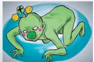
●日本漫畫家「還原」真實吉祥物。網上圖片