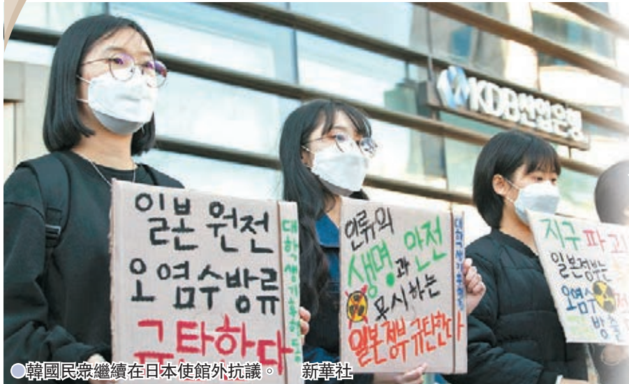
●韓國民眾繼續在日本使館外抗議。新華社