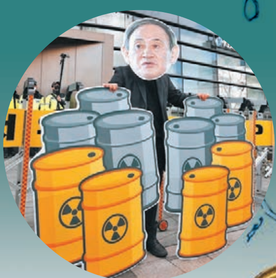
示威者譴責日本首相菅義偉。