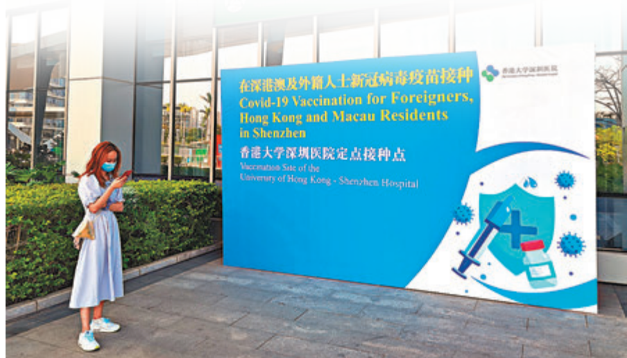
●港大深圳醫院疫苗接種點。