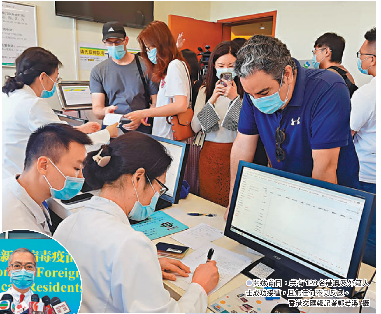
●開放首日，共有128名港澳及外籍人士成功接種，且無任何不良反應。

「您」需要先在2區填寫知情同意書和登記表，然後去3區預檢檢查，4區接種，最後留觀30分鐘……」走進港大深圳醫院疫苗接種門診，迎面而來的工作人員貼心的送上接種流程指引。香港文匯報記者看到，接種點共設5個接種台，牆上貼了1至6的數字號碼牌指引，分別對應接待區、填表區、預檢登記室、接種室、收費區、留觀區，從入口到出門，採用單向通道的設置，避免走「回頭路」。此外，院方還提供了英語和粵語引導服務，接種後如有不良反應，可24小時電話諮詢。