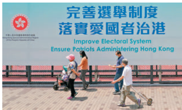
●特區政府立法會秘書處公布,《2021年完善選舉制度(綜合修訂)條例草案》今天提交立法會作首讀及二讀。圖為香港深水埗街頭的「完善選舉制度 落實愛國者治港」巨幅廣告牌。

為確保功能界別選民與有關界別具有實際和密切聯繫,並防止種票行為,草案建議規定若不屬法例列明的團體,只有取得相應資格後持續運作三年以上的團體,方可登記為功能界別的團體選民。至於因界別和選民基礎增減而受影響的選民,則須於7月5日前重新登記。