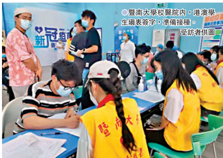
●暨南大學校醫院內,港澳學生填表簽字,準備接種。

王華慶表示,中國要建立免疫屏障,可能需要10億以上的人接種新冠疫苗,接種率越高,免疫屏障就越牢固。他表示,如果大家接種得快,這個屏障可能會早一天到來。要盡早恢復到正常的生活,疫苗是目前的最佳選擇。對於接種新冠疫苗阻止病毒變異的作用,王華慶表示,如果疾病一直蔓延下去,病毒變異的速度就會變快。相對地,疾病的嚴重程度和傳染性都會增加。阻止病毒變異速度加快的最好辦法就是接種疫苗,接種疫苗後人們有了免疫力,就不會成為傳染源,病毒就傳播不下去了。王華慶還表示,中國接種新冠疫苗後有不良反應或者嚴重過敏性反應的,約為百萬分之一,而新冠肺炎的死亡率為2%。可以看出感染新冠肺炎帶來很大的危害,而疫苗是可以採取一些措施把風險降到最低。根據目前III期臨床試驗的結果,疫苗其實對大多數人產生了保護作用,有的是不會感染,有的是不讓人發病,還有主要是重症或死亡得到預防。