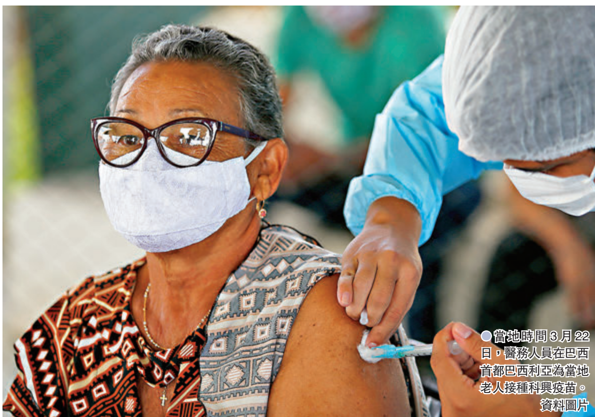
●當地時間3月22日,醫務人員在巴西首都巴西利亞為當地老人接種科興疫苗。資料圖片

對巴西變異病毒有一致中和作用 研究還顯示,克爾來福對於P.1和P.2這兩種變異新冠病毒同樣有效。莊時利和表示,巴西主要有三種新冠病毒株,分別是B.1.1.28、P.1和P.2,第一種是野生型,後兩種是變異體,布坦坦研究所所在地區的主要變異體是P.2。45名檢測的志願者血清對B.1.1.28、P.1和P.2的中和活性比例分別為32人(71.1%,