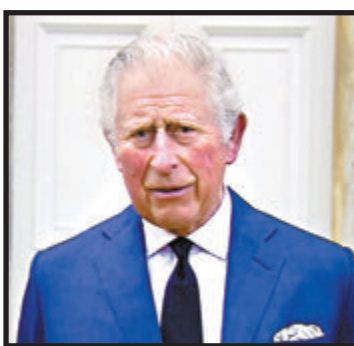
●查爾斯會見傳媒,談及喪父感受。

不過雙方關係近年有所改善,父子倆開始懂得「和而不同」,最具象徵性的是2017年,菲臘決定將家族農園交給查爾斯打理,即使菲臘對於查爾斯將農園改為有機種植不以為然,他也尊重兒子的決定。