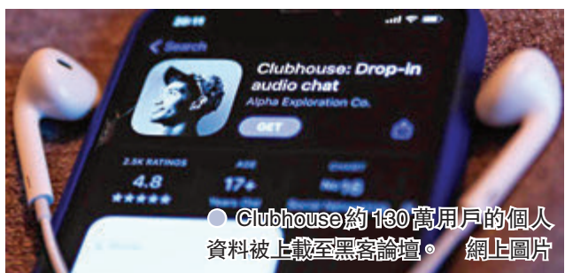
●Clubhouse約130萬用戶的個人資料被上載至黑客論壇。網上圖片

香港文匯報訊(記者 成祖明) 語音社交媒體平台 Clubhouse 多達130萬用戶個人資料疑遭外洩。香港個人資料私隱專員公署表示,留意到有關事件,考慮到懷疑涉及的個人資料或包括姓名、社交網站賬戶名稱和號碼等,私隱公署正聯絡 Clubhouse 了解事件是否涉及香港用戶和所涉及的個人資料,私隱公署會提醒 Clubhouse,如發現香港用戶受到影響,應盡快通知受影響用戶,以減低事件所產生的風險。私隱公署會繼續