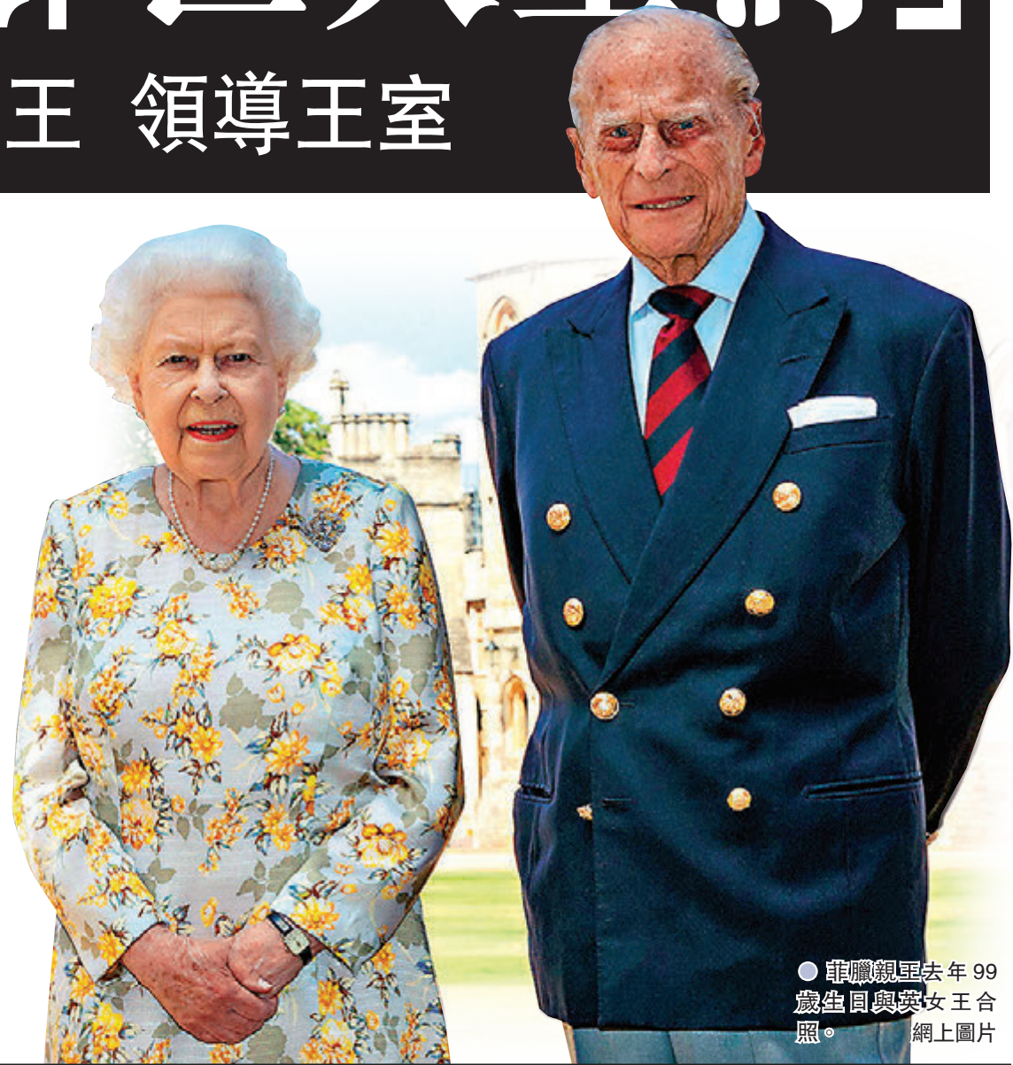
●菲臘親王去年99歲生日與英女王合照。網上圖片