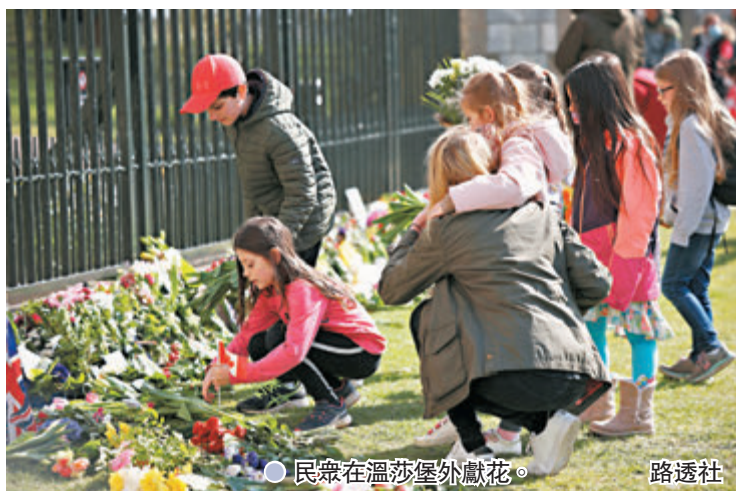
●民眾在溫莎堡外獻花。

報道指,菲臘與查爾斯兩父子關係向來疏離,曾經有過一段時間,兩人只靠信件聯絡,每逢見面總會因為某些事而大吵一場。不過報道提到,菲臘當年沒有像坊間盛傳般強迫查爾斯娶戴安娜,兩人也從來沒有因為此事反目,反而是1994年查爾斯在專訪中承認與卡米拉有婚外情,並且公開批評父母,令菲臘大為震怒。此外,菲臘與查爾斯對王室前景、宗教和環保等議題亦有分歧,例如查爾斯熱衷於有機耕種,菲臘卻不太認同,更於2008年公開唱反調,支持基因改造農作物。