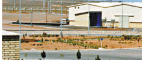
●納坦茲鈾濃縮核設施出現電力故障。

電力故障,不過他未有透露故障是否波及核設施,僅表示當局正調查事故起因。納坦茲核設施去年7月曾經起火,造成新建離心機受損,有傳言指以色列牽涉其中。今次事發後,亦有以色列記者聲稱,以色列涉嫌對伊朗核設施「發起網攻」,不過相關說法未獲證實。