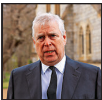
●安德魯到溫莎堡教堂出席周日彌撒。