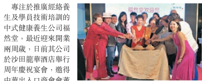
●老闆與員工一齊切蛋糕慶祝。

專注於推廣經絡養生及學員技術培訓的中式健康養生公司福然堂，最近迎來開業兩周年，日前其公司於沙田龍華酒店舉行周年慶祝宴會，邀得中華出入口商會會董歐麗龍、跨媒體創作