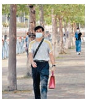
●如敏感的話，建議佩戴口罩。

春養肝，在春三月要順應肝氣疏散生發的特性加以調養。此時陽氣漸長，陰氣漸消，要早睡早起；飲食有節，多甘少酸；和於術數，以動養肝；不妄勞作，張弛有度。肝喜條達，別自找鬱悶，以防肝鬱氣滯。保持心情舒暢、心胸寬廣，聽音樂、釣