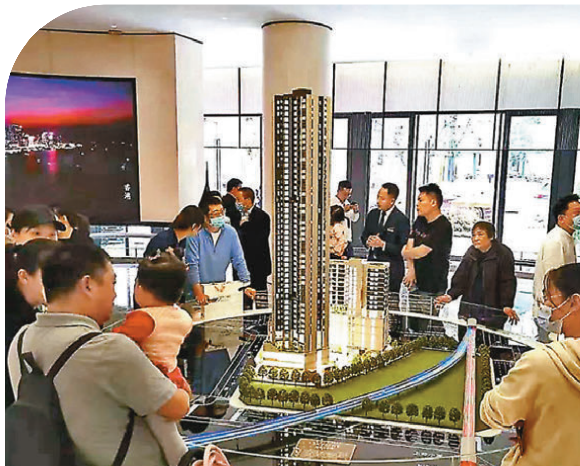
去年下半年深圳二手房漲幅達數成，並推高新房漲價的壓力。圖為深圳龍華一樓盤的銷售現場。

今年兩會政府工作報告繼續提出「房住不炒」「三穩」等定位，隨後全國一線城市和許多二線城市紛紛出台政策規範和嚴控房地產市場。去年下半年深圳二手房漲幅達數成，並推高新房漲價的壓力。因此，炒樓客成為過街老鼠人人喊打。深圳市出台「2.8」新政，嚴打炒家將二手房炒高，抬高其入市門檻。此後深圳市又出台政策，讓網友舉報炒樓線索，並按線索展開嚴打。