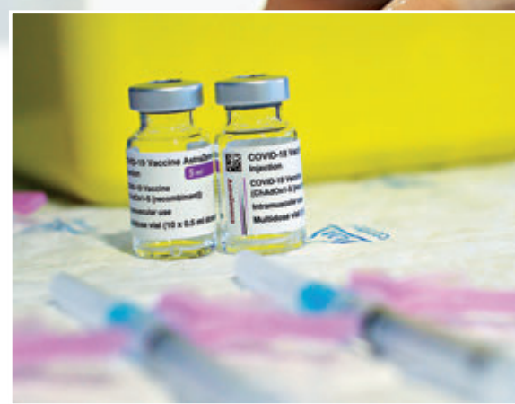
▲陳肇始昨日表示,由於香港現時已有足夠疫苗供全港市民接種,故阿斯利康疫苗毋須於今年供港,以免造成浪費。圖為阿斯利康疫苗。資料圖片