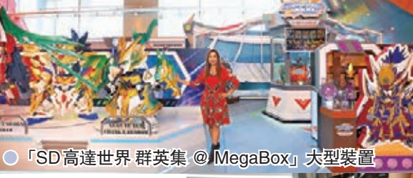
● 「SD 高達世界 群英集 @ MegaBox」大型裝置

今年，MegaBox 與超人氣SD 高達攜手，由即日起至4月18日期間，呈獻全港首個「SD 高達世界 群英集 @ MegaBox」大型裝置，裝置內除了有5位SD 高達世界成員及3位高達盟友與大家見面，更有一系列模型及珍貴產品展覽，以及多款超人氣及限定版模型於期間限定店率先曝光，部分期間限定模型更於商場獨家首次發售，各位粉絲及潮玩收藏家絕對不容錯過。