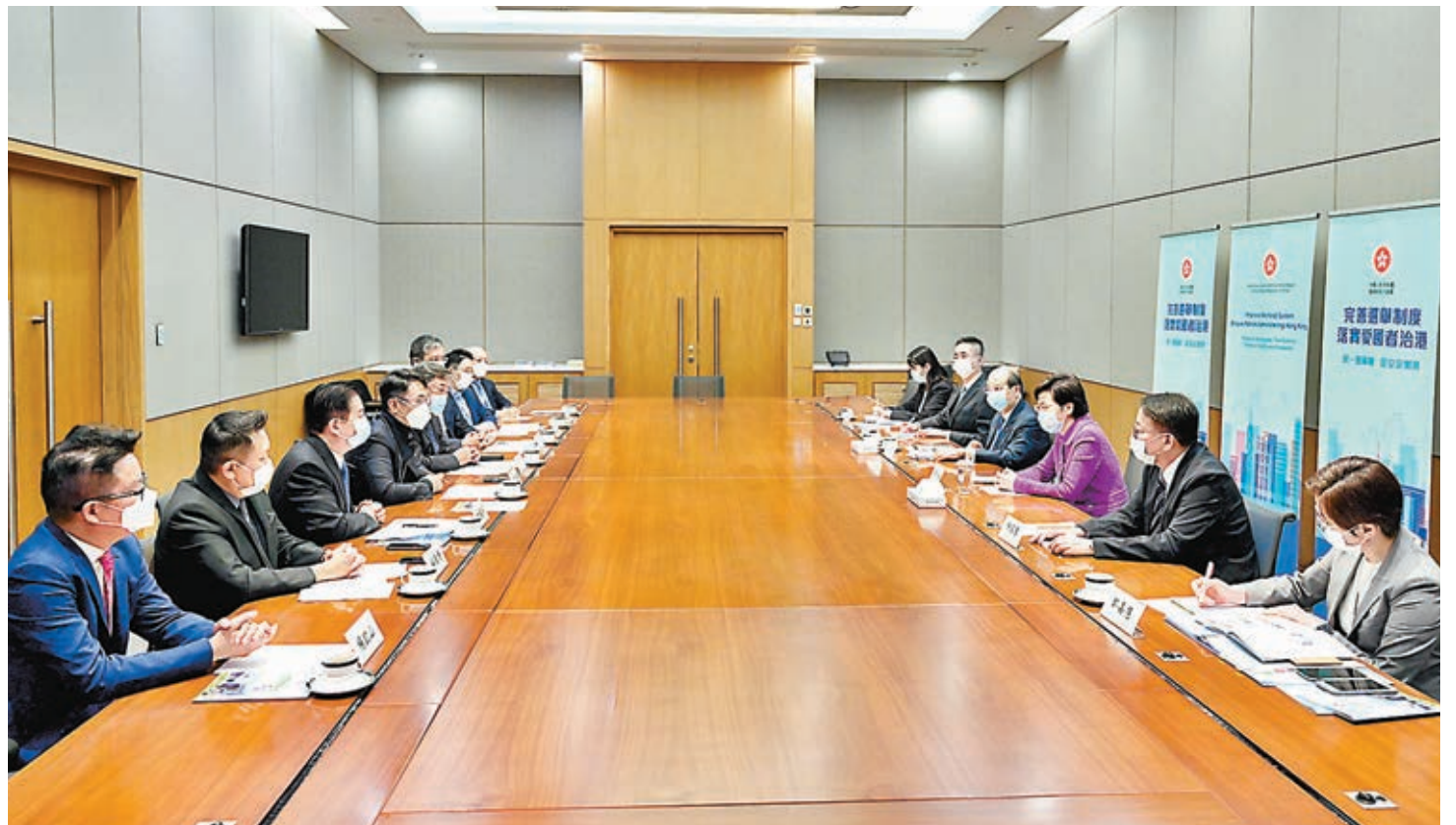
●林鄭月娥出席其中一場會面，並回答與會者的提問。

政務司司長張建宗昨日主持兩場解說會，與部分全國性團體的港人代表會面，就完善香港特別行政區選舉制度繼續進行解說。林鄭月娥出席了其中一場會面，並回答與會者的提問。