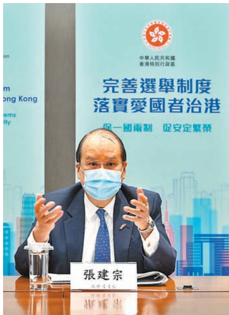
●張建宗在其中一場解說會發言。