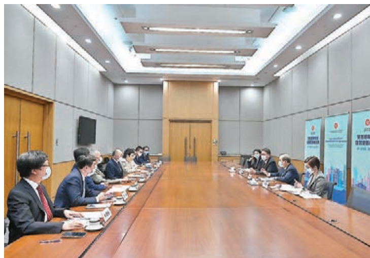
●張建宗與部分全國性團體的港人代表會面。

他認為，雖然特區政府近日的解說、宣傳工作做得不錯，但由於新制度比較複雜，故十分支持特區政府深入淺出、耐心地對各界人士及普羅市民做好解說。