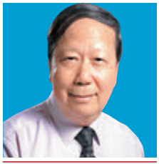
周全浩教授 能源及股市分析家、浸會大學退休教授、專欄作家「張公道」