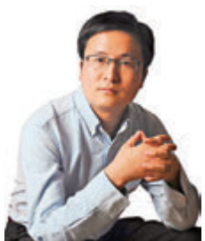
宋清輝 著名經濟學家

據《人民日報》近日報道，中國已是世界最大棉花消費國、第二大棉花生產國，2020/2021年度棉花產量約595萬噸，總需求約780萬噸，年度缺口約185萬噸。據調查，含棉花製品的衣服數量，在中國服裝產業中只佔一小部分，如化纖、滌綸、羊毛、絲綢、呢絨、蠶絲、真絲等材質的衣物，這些材料製成的衣物在各地消費者密集的市場也是大賣。