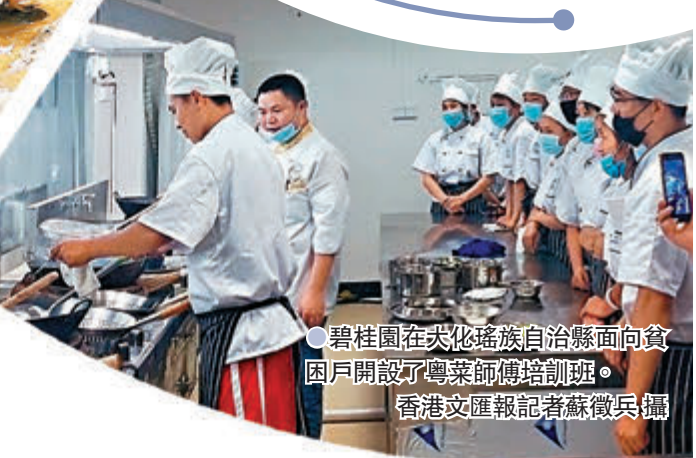
碧桂園在大化瑤族自治縣面向貧困戶開設了粵菜師傅培訓班。