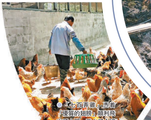
「七百弄雞」憑着「優質的翅膀」順利飛出了山間，登上了全國兩會餐桌。