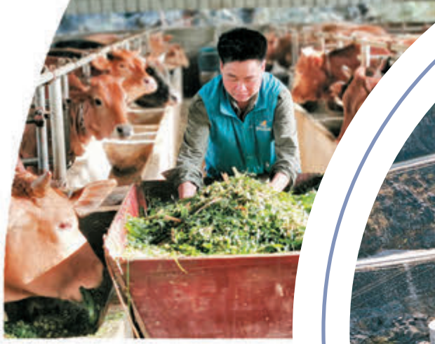
碧桂園企業與村民「聯建聯養」的肉牛養殖業。

不再為水發愁後，村民們的精神狀態煥然一新，思路也跟着活起來。千山萬弄間，「解渴」的土地上特色養殖業漸成規模。碧桂園還解決了勝利村三個肉牛養殖場飲水問題，各建設一個300立方的水櫃，目前已完成5個水櫃建設工程。