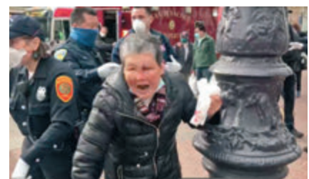
當地時間3月17日，華裔婆婆在舊金山市場街遭遇一名美國白人襲擊。

諾，嚴厲打擊針對包括亞裔美國人在內的少數族裔的歧視和仇恨暴力行爲，切實保障少數族裔各項權利，讓少數族裔擺脫歧視仇恨犯罪的噩夢，不再生活在暴力和恐懼之中。」趙立堅說。