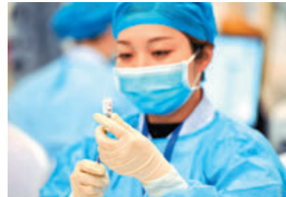
「過敏體質」、備孕者均可以接種。

針對備孕者，中國疾病預防控制中心免疫規劃首席專家王華慶說，基於對新冠病毒疫苗安全性的理解，備孕期男女雙方都可以接種新冠病毒疫苗。如果接種疫苗之後發現懷孕了，