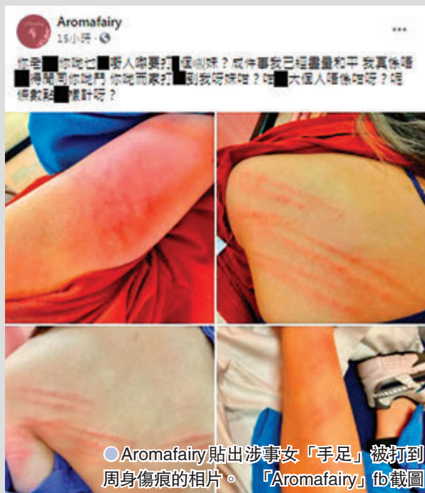
Aromafairy貼出涉事女「手足」被打到周身傷痕的照片。

自稱「出冊手足」嘅「Aromafairy」店主4月3日嘅Instagram發文，話個檔位原來係由「hk9cake」同「Yellowbirds.hk」借佢賣香膏，而涉事兩位女「手足」當日正係以受薪形式幫手睇檔，結果女「手足」俾「軍火佬」騷擾完後就打電話畀佢哭訴。