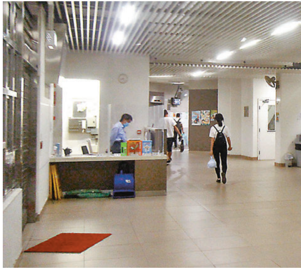
●安達邨各座大堂均有保安員當值。