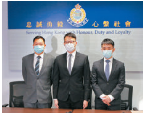
●警方昨日簡報上週於秀茂坪安達邨發生的入屋爆竊及猥褻侵犯案的詳情。

警方正追查兩人有否涉及其他同類案件，呼籲曾遇到同類案件而未報案的市民，聯絡警方或致電3661 6237，向秀茂坪警區重案組提供資料。