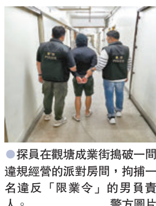
●探員在觀塘成業街搗破一間違規經營的派對房間，拘捕一名違反「限業令」的男負責人。

沒有確保該處所內正在使用的桌子之間保持最少有1.5米距離、沒有確保使用者在進入處所前利用手機掃描「安心出行」二維碼，或登記有關人員的個人資料，以及沒有安排涉及處所運作的員工保留新冠病毒病檢測記錄，遂以違反「限業令」，向相關食肆負責人發出傳票。 在灣仔區，警方前晚11時許亦展開代號「五角」的行動，突擊巡查區內多間娛樂場所，其間揭發一間位於謝斐道324號至338號的酒吧違反「限業令」於晚上10時後仍然營業，遂向一