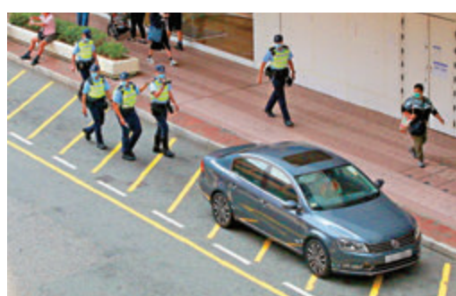
●警方流動攝錄隊人員在沙田正街拍攝記錄一輛違泊私家車。

高濬續說，公眾十分關注交通擠塞問題，警方會適當調配資源作出相應打擊，而非截停模式的錄影執法除可避免一些不必要的衝突外，亦有助加強搜證及提高檢控成功。他強調，攝