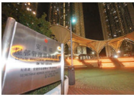
●發生入屋爆竊及猥褻女童案的安達邨。