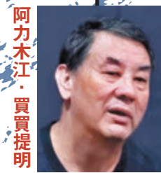
阿力木江·買買提明 時任新疆維吾爾自治區教育廳副廳長