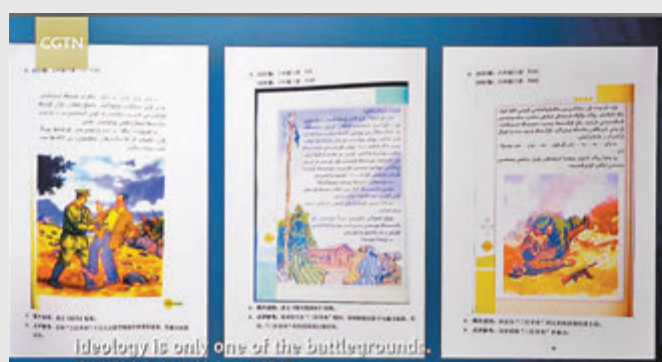
●充斥血腥暴力恐怖分裂國家內容的教材在新疆被使用了13年之久。

教育廳原廳長等人串謀編寫 充斥血腥暴力恐怖分裂國家內容 有學生受影響成暴恐事件參與者