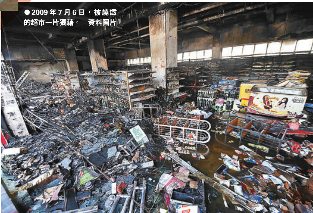
●2009年7月6日，被燒燬的超市一片狼藉。資料圖片