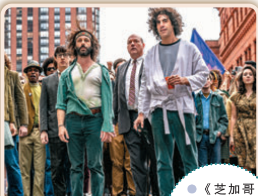
●《芝加哥七人案:驚世審判》贏得最高榮譽。(劇照)