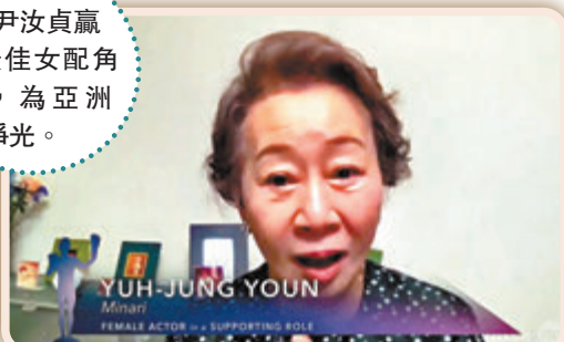
●尹汝貞贏得最佳女配角獎,為亞洲爭光。