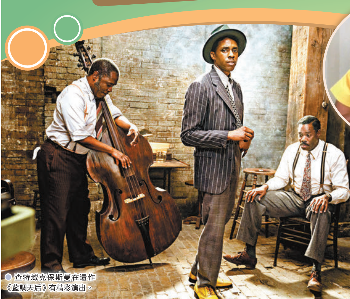
● 查特域克保斯曼在遺作《藍調天后》有精彩演出。