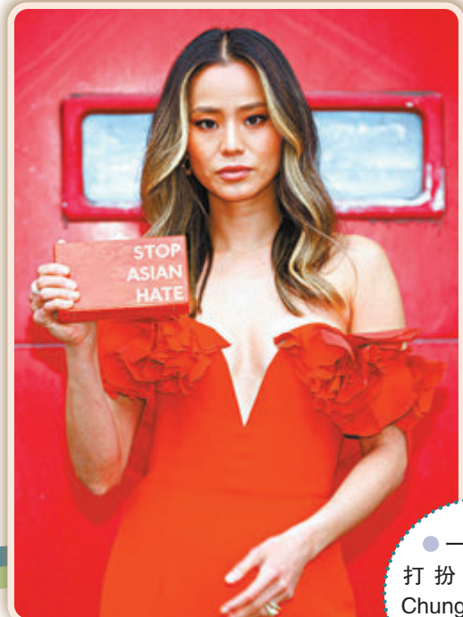
●一身火紅打扮的 Jamie Chung 呼籲停止仇視亞洲人。