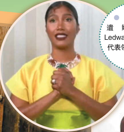
●「黑豹」的遺孀 Simone Ledward Boseman 代表領獎。