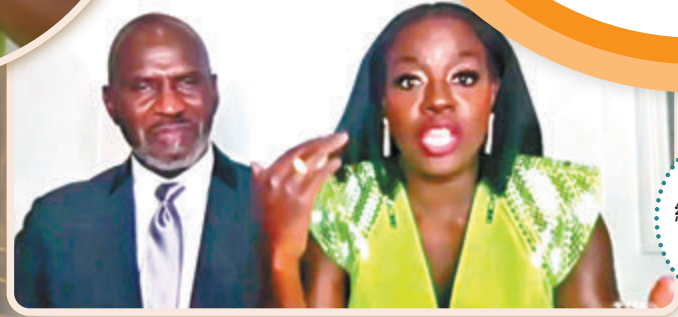
●維奧拉戴維斯在丈夫陪同下致謝詞。

香港文匯報訊(記者文芬)第27屆美國演員工會獎(SAG)昨日揭曉,此獎一直被視為奧斯卡重要的得獎風向標。Netflix電影《芝加哥七人案:驚世審判》奪得最高榮譽的最佳群體演出獎,已故影星「黑豹」查特域克保斯曼與維奧拉戴維斯憑《藍調天后》分別奪得影帝影后殊榮。值得一提的是,韓國女星尹汝貞憑《農情家園》贏得電影類最佳女配角。